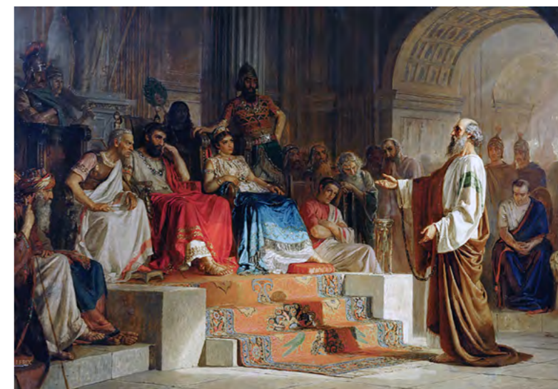
Николай Бодаревский. Апостол Павел в Кесарии. (1896 г.)

Господа Бога святите в сердцах ваших; будьте всегда готовы всякому, требующему у вас отчета в вашем уповании, дать ответ с кротостью и благоговением [Пт. 3, 8-15].