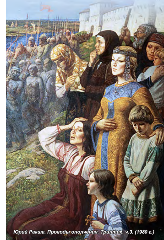
Юрий Ракша. Проводы ополчения. Триптих, ч.3. (1980 г.)