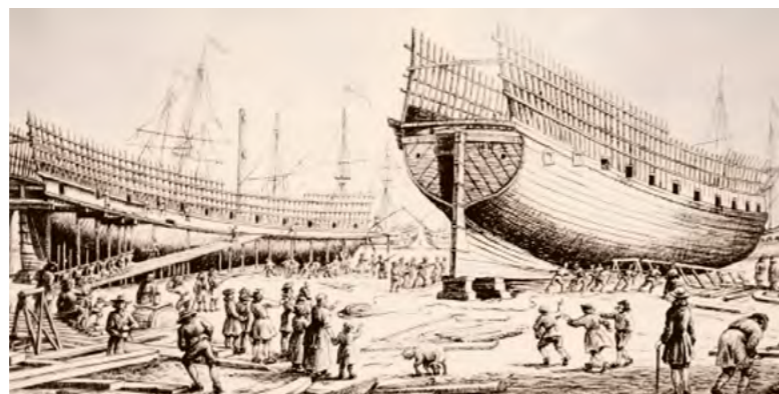
Строительство азовской флотилии. Старинная гравюра.

Ясно же, что «просто так» ничего не делалось и не писалось – корабельные символы, выраженные в аллегориях и метафорах, всегда носили в себе глубинный смысл. Как соотносить Центральное Черноземье с пальмами, да ещё с финиковыми? Некоторые исследователи полагают, что эмблема и символ «Воронежа», согласно голландскому эмблемату, означали планомерный переход пальмы