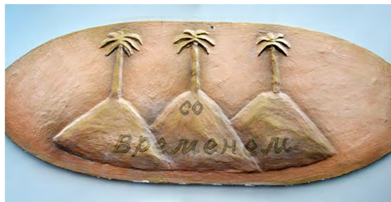
Эмблема корабля «Воронеж». Современный вариант.

Не случайно и упоминание царём апостольского имени, ведь святые Пётр и Павел являлись небесными покровителями Петра I, что не раз выражалось в символике воронежских кораблей. На корме того же «Гото Предестинация» изображен коленопреклоненный в святой молитве апостол Пётр.