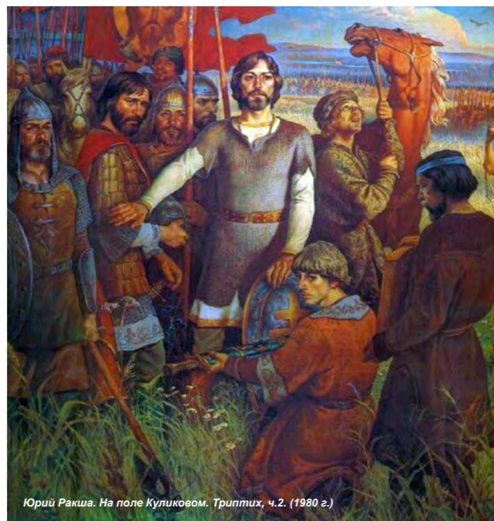
Юрий Ракша. На поле Куликовом. Триптих, ч.2. (1980 г.)

помешать этому) последовательно и гармонично. Тем самым обеспечивалась внутренняя стабильность и внешняя крепость страны. Росла численность населения, расширялась территория, развивались наука и культура, увеличивалась экономическая, политическая и военная мощь, повышалась притягательность «русского образа жизни».