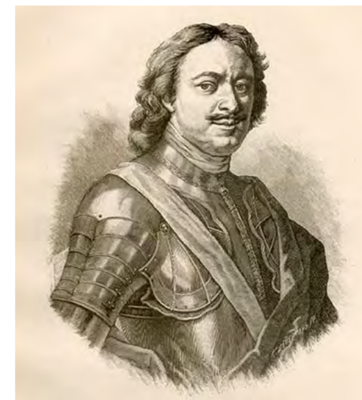
Петр Великий. С гравюры Хубракена.

Знаменательно, что за три года до Полтавского сражения в крепости срубили Спасскую церковь. Храм помог защитникам города выдержать трёхмесячную осаду. В нём молились о даровании победы, рядом хоронили защитников Полтавы и клеймили позором тех, кто предлагал открыть врагу крепостные ворота.