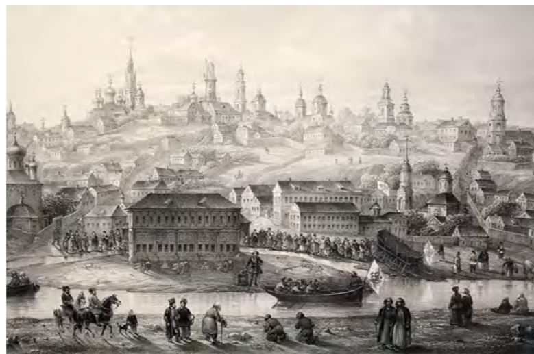
Воронеж времён Петра. Старинная гравюра.

При всём разнообразии перемен, происходящих на глазах наших предков, Воронежская земля, прежде всего, хранит память о брошенном в благодатную ниву малом зёрнышке, из которого впоследствии вырастет могучий ствол под названием Российский флот. И потому будет не лишним вспомнить некоторые нюансы, которые, хотя и касались кораблестроения, но вместили в себя разные грани той весьма колоритной жизни.