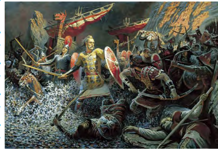
Ян Матейко. Грюневальдская битва. (1878 г.)

В истории Руси упадок воинского духа, междоусобицы и внутренние раздоры всегда были одним из наиболее грозных признаков надвигающейся беды. В период разобщённости удельных княжеств на наших предков обрушилась татаро-монгольская зависимость. Будучи выдающимися и сплочёнными воинами, монголы покорили тогда русские земли, проявив особые навыки воинского мастерства. Это умение долго отступать, оставляя после себя выжженную землю и истощая противника перед тем, как заманить его в ловушку. Это готовность довольствоваться малым при победе и не преследовать разбитого противника без особой необходимости. Это мудрость принимать поражение, осмысливать его и быстро восстанавливаться. И, конечно же, практика военных действий зимой, с обращением лютых морозов, снега и льда в своих союзников. Всё это позже станет достоянием нашей армии.