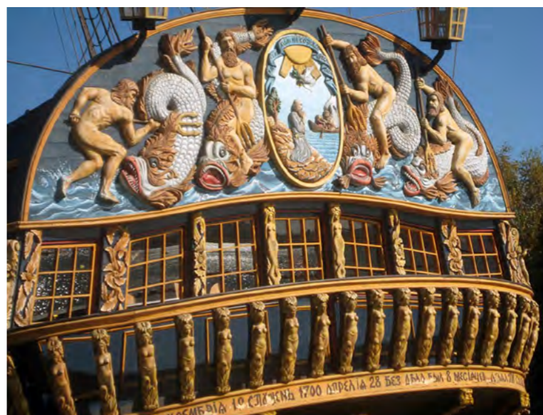
Корма корабля «Гото Предестинация».

первенства: от старой столицы – Москвы – к новой, строящейся – Санкт-Петербургу, через временную столицу – Воронеж.