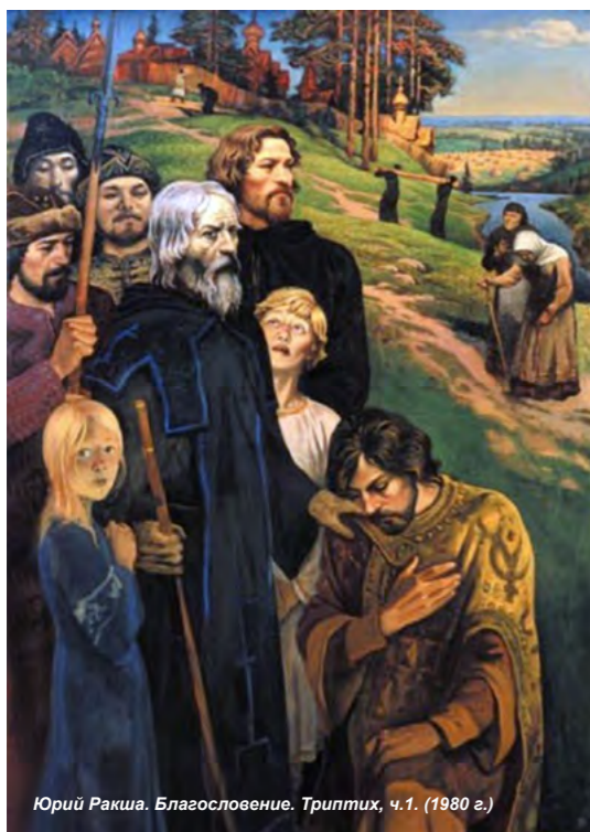
Юрий Ракша. Благословение. Триптих, ч.1. (1980 г.)

Главной задачей для всех, кто болеет душой за Россию, должно стать восстановление исторической преемственности русской жизни. На протяжении почти десяти веков русское общество развивалось (несмотря на многочисленные попытки