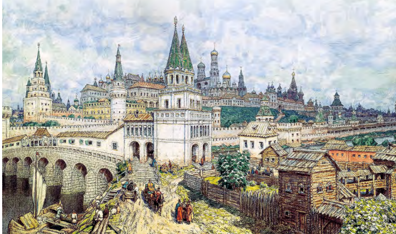
Аполлинарий Васнецов. Расцвет Кремля. Всехсвятский мост и Кремль в конце XVII века. (1922 г.)

Чтобы не повторить печальную судьбу Древнего Рима, России надо было дать ответ на этот исторический вызов. Таким ответом стало возникновение на берегах Невы Санкт-Петербурга – новой столицы Империи, где всё инородное переосмысливалось, а если принималось, то становилось русским. На гребне петровского градостроительства в Северной столице появилась и первая Академия наук, а вместе с нею – первый университет, а для него – и первая классическая школа.