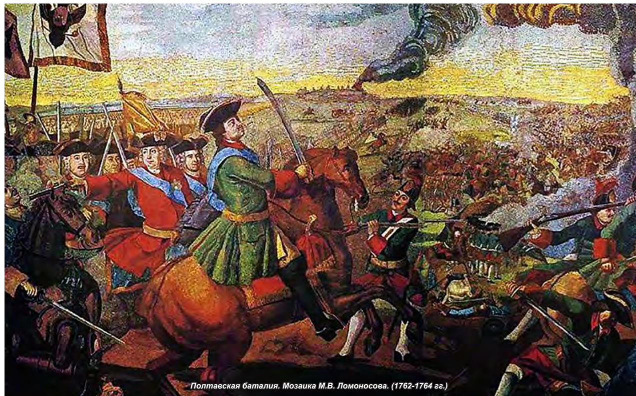
Полтавская битва. Мозаика М.В. Ломоносова. (1762-1764 гг.)

По царскому сигналу вперёд двинулись преображенцы. Замелькали их ноги в красных чулках. Такую форму Преображенскому полку установили после несчастливой для русских сражения под Нарвой, когда наш старейший полк, стоя по колено в крови, не бежал от шведской короны, но отступил, не ломая строя, чем спас армию.