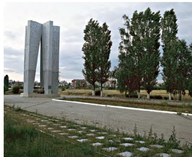
Мемориал «Песчаный лог».

даже с «аушвайсом» на временное проживание. Никаких оправдательных бумажек, естественно, у беглецов не оказалось. Некоторое время жили в поле за колючей проволокой (в этой части Воронежской области немцы немало организовали подобных пересыльных пунктов). Голодали, конечно. В один из дней, не выдюжив, умерла старшая сестра Елены. А потом фашисты всех, кто находился на пересылке, выбросили за колючую проволоку. В Германию их отправлять не стали, работать измождённые люди оказались неспособны. Немцы так и заявили: топайте, куда хотите. А куда идти, в другое село? Там то же самое. Подселились к одинокой старушке, которую в Курбатове все звали Веденевна. Хата Веденевны стояла недалеко от немецкого госпиталя.