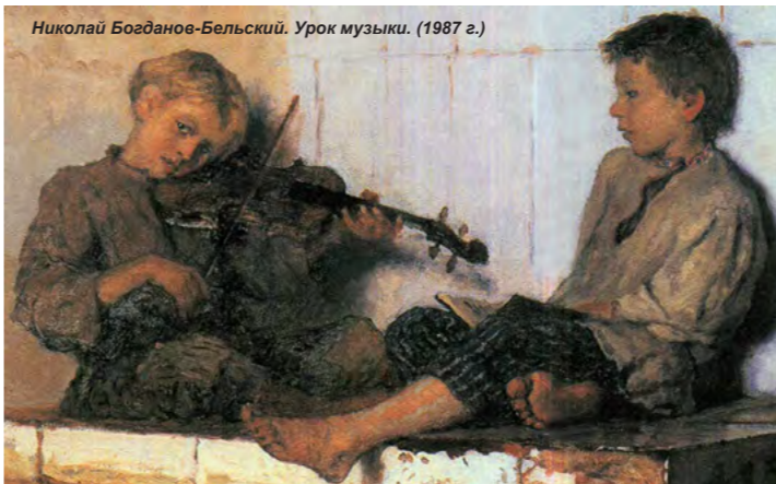
Николай Богданов-Бельский. Урок музыки. (1987 г.)

«Вот я вырезаю по дереву. Это удается мне потому, что я владею моим скобелем и могу делать с деревом все, что захочу. Поэтому я могу вложить в мою резьбу все мое сердце и показать людям, какая бывает на свете нежная красота и радость».