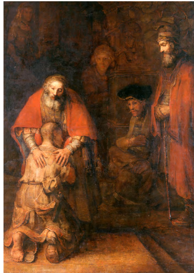
Рембрандт Харменс ван Рейн. Возвращение блудного сына. (1666-1669 г.)