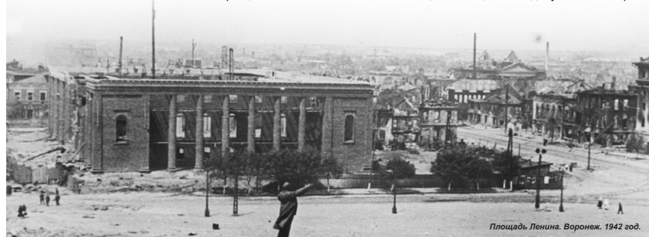
Площадь Ленина. Воронеж. 1942 год.