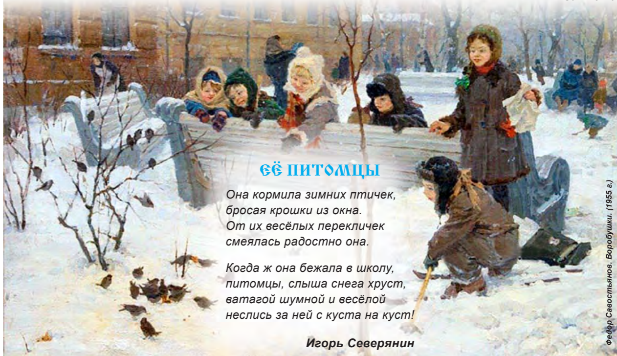
Игорь Северянин. Ёё питомцы. (1955 г.)