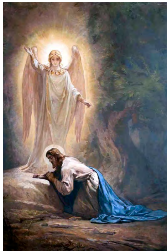
Николай Кошелев. Моление о чаше. (Конец XIX в.)

Если небо покрывается сгустившимися тучами, громы ударяют, подобно пушечным выстрелам, с непрерывным сверканьем молнии – тогда приказывают звонить в колокола для разрежения грозных туч и, вместе с тем, для призыва всех к усердной молитве Богу о помиловании нас, грешных, и о Его помощи для спасения. Подобным образом должны поступать и мы, когда замечаем, что праведное солнце Воли Божией удаляется от нас, и мы совершенно не знаем, что делать. Необходимо возвести очи наши к Небу и усердными молитвами стучать в него, говоря: «Господи, что повелишь мне делать?».