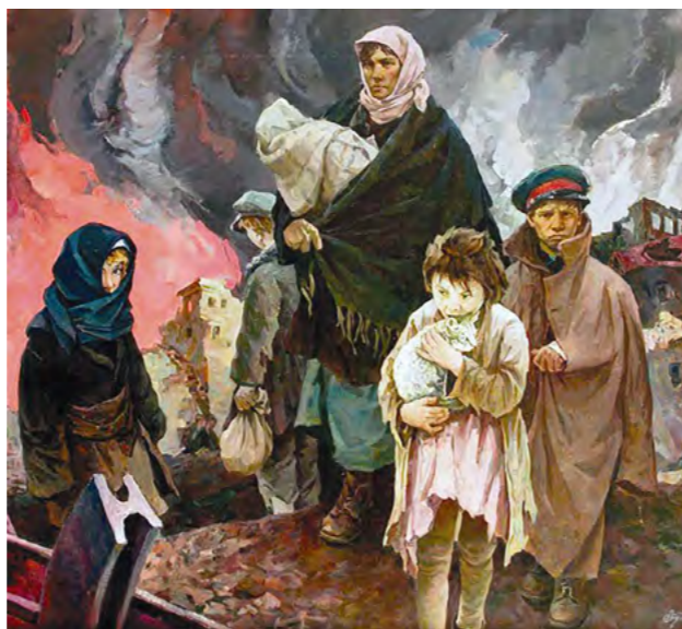
Адольф Гугель. Дети войны. (1984 г.)

– Где? – она бросилась снимать неудобный кирзовый сапог с ноги сына. Пальцы и часть ступни были мертвенно-белого цвета: обморожены!.. Худой сапог