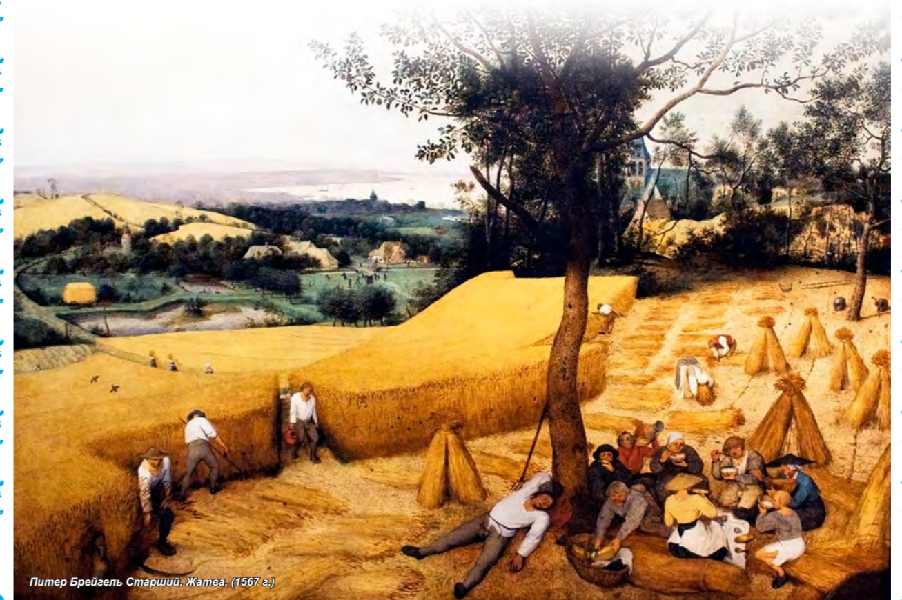
Питер Брейгель Старший. Жатва. (1567 г.)