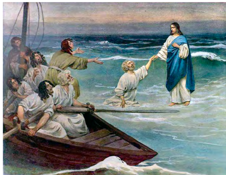
Клавдий Лебедев. Хождение Христа по водам. (Начало XX в.)

Вот, был у меня друг, которому я обязан очень многим, и верой своей – в первую очередь. Он умер двенадцать лет назад, и я думал, никогда не забуду его, буду всегда поминать его, уж на Литургии-то – обязательно. И вдруг с ужасом осознаю, что одна Литургия прошла, другая – а я его, одного из самых дорогих для меня людей – и не помянул! И мне страшно стало за свою духовную расслабленность, за неблагодарность человеку, который столько сделал для меня. А каждый ли день мы поминать с должной ревностью родителей наших – живых и усопших?