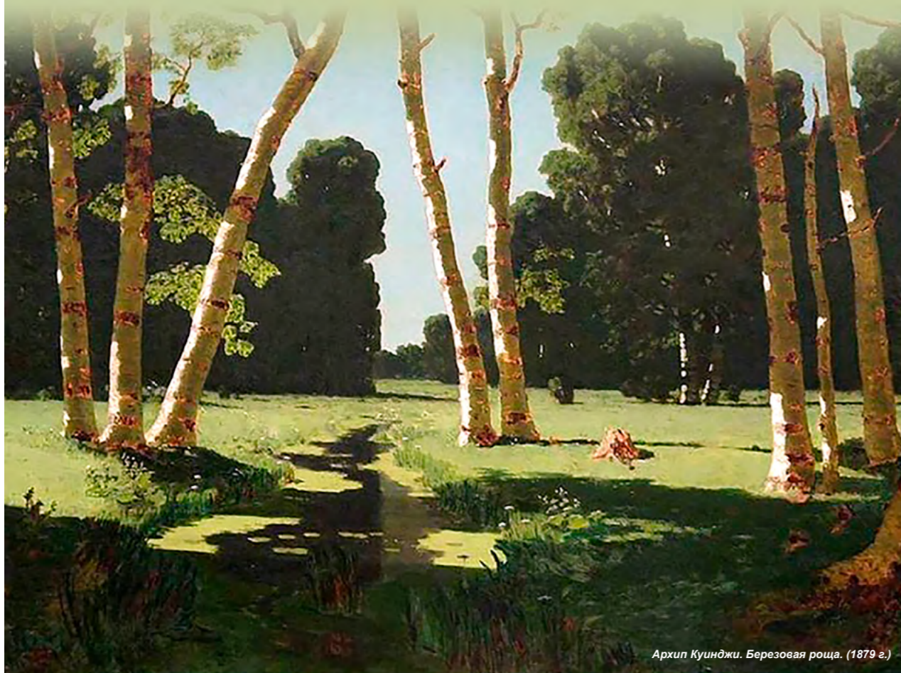
Архип Куинджи. Березовая роща. (1879 г.)