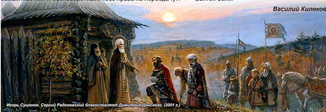
Игорь Сушенюк. Сергий Радонежский благословляет Димитрия Донского. (2001 г.)

С вопросами и предложениями можно обратиться к протоиерею Николаю Бабичу: тел.: +7 (951) 860-40-40, Viber: +7-951-860-40-40, ВКонтакте: vk.com/snt.antonius, Telegram: @NikolaiBabich.