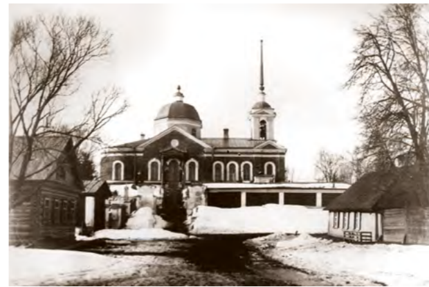
Церковь Смоленской иконы Божией Матери (кладбищенская). Тверь.

В Великую Субботу гимн повторяет эти слова пророка, подчёркивая их безграничную глубину.