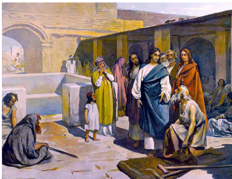
Клавдий Лебедев. Исцеление расслабленного у Овчей купели. (Начало XX в.)

Сегодня для многих из нас наступило время выбора и уточнения собственных нравственных координат. Пришла пора ответить себе на вопрос: кто я, так ли живу, как вечной душе человеческой потребно?