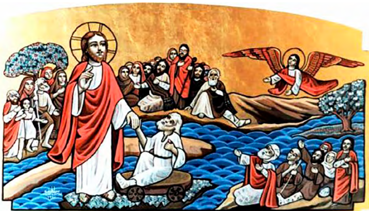
Господь исцеляющий. Коптская икона.