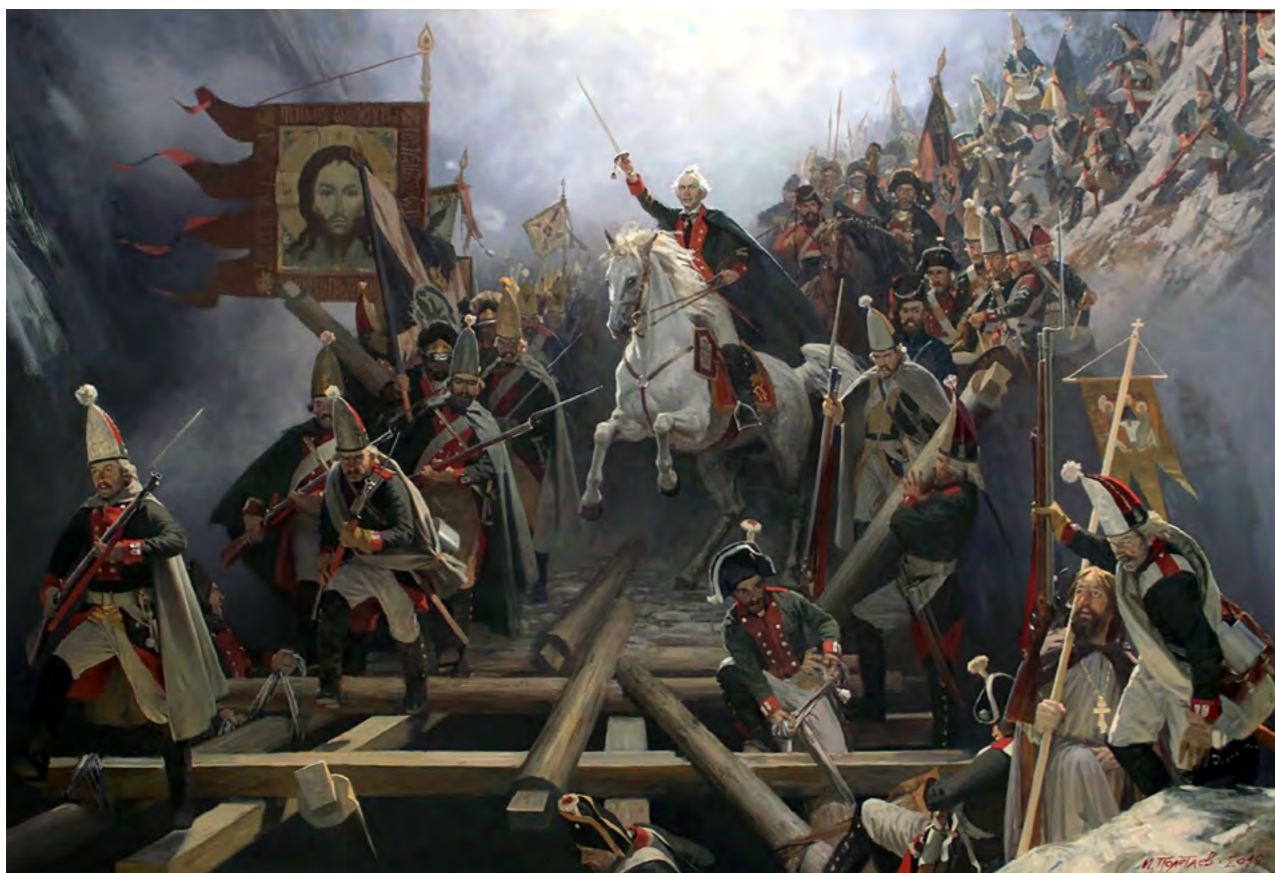
Михаил Полетаев. Молись Богу - от Него Победа. А.В. Суворов. Чёртов мост. (2019 г.)

Большинство людей, употребляющих эти, ставшие обиходными, пословицы и поговорки, не связывают их с авторством Александра Суворова. И это подтверждает, что Александр Васильевич стал выразителем народной мудрости. Более того, он ещё и стихи писал. Наиболее известное двустишие – доклад Румянцеву о взятии в ходе разведки боем в мае 1773 года турецкой крепости на Дунае: «Слава Богу, слава Вам, Туртукай взят, и я там».