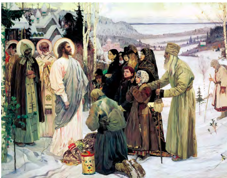
Михаил Нестеров. Святая Русь. (1901-1906 гг.)

«Господь близко», – напоминает святой апостол Павел в Послании к Филиппийцам [Фил. 4, 5].