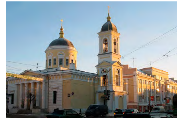
Собор Вознесения Господня. Тверь.

В некоторых изводах иконы в складках риз Младенца угадываются очертания чаши, из которой золотыми струями текут потоки Живой Воды, обещанной Христом в Евангелии. «И будет в тот день, живые воды потекут из Иерусалима» [Зах. 14, 8].