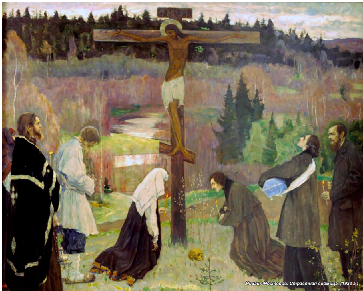
Михаил Нестеров. Страстная седмица. (1933 г.)

Тогда, во время проповеди Своей на земле Господь призвал к исцелению всех болезнующих грехом, не признав никакого греха – неисцельным. И теперь Он продолжает призывать нас к покаянию, обещая и даруя прощение всякого греха, исцеление всякого греховного недуга.