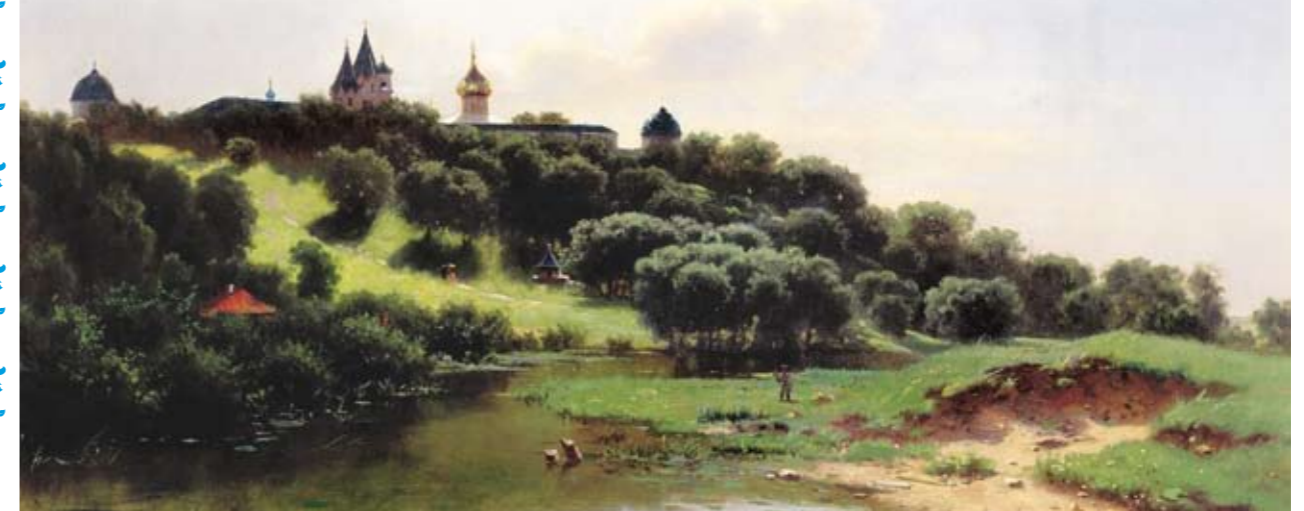
Лев Каменев. Саввино-Сторожевский монастырь под Звенигородом.