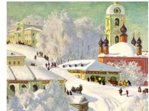
Борис Кустодиев. Весна. Фрагмент. (1921 г.)

По книге «Антоний, святитель Воронежский»