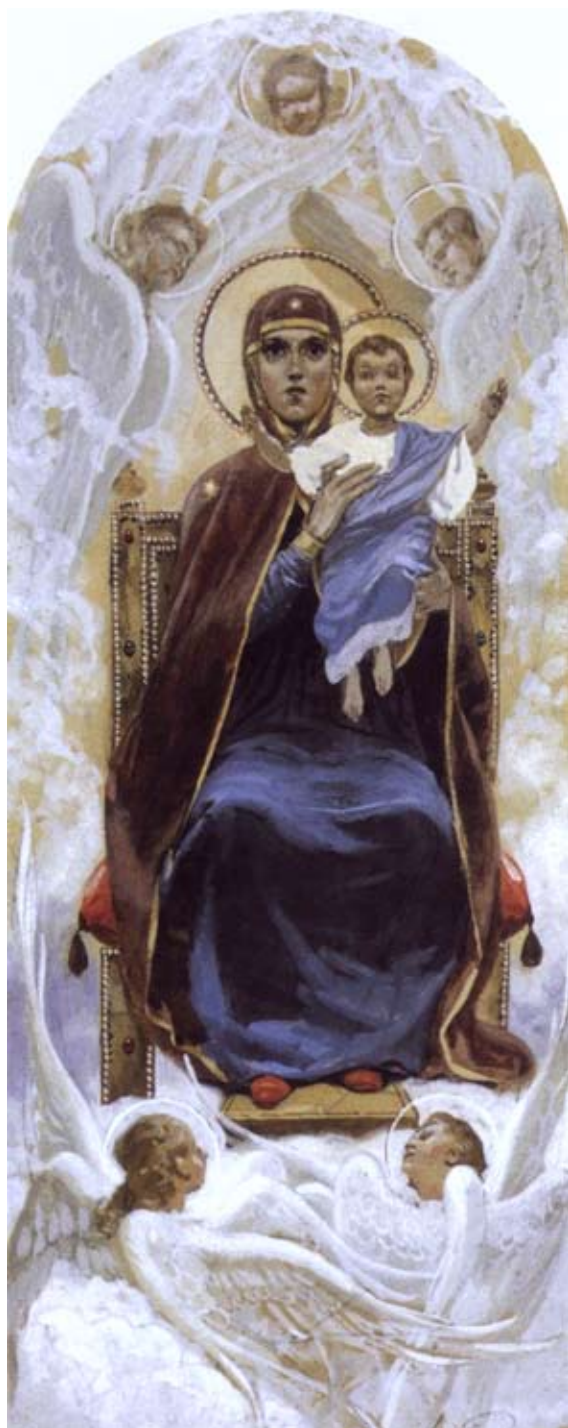
Андрей Рябушкин. Богоматерь с Младенцем на троне. (1894-1895 гг.)