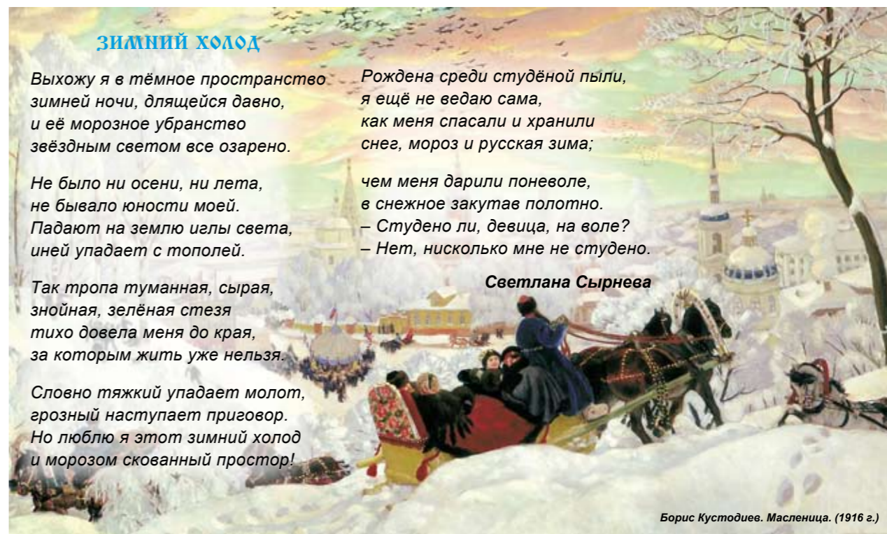
Борис Кустодиев. Масленица. (1916 г.)