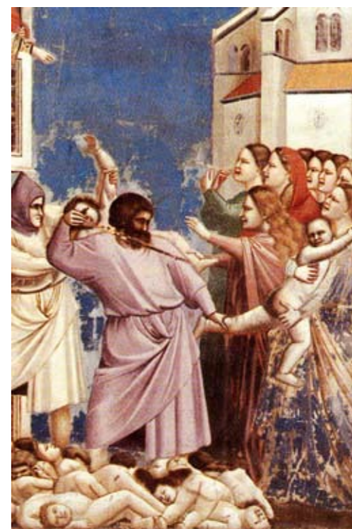
Избиение младенцев. Фреска Джотто в капелле Скровеньи.