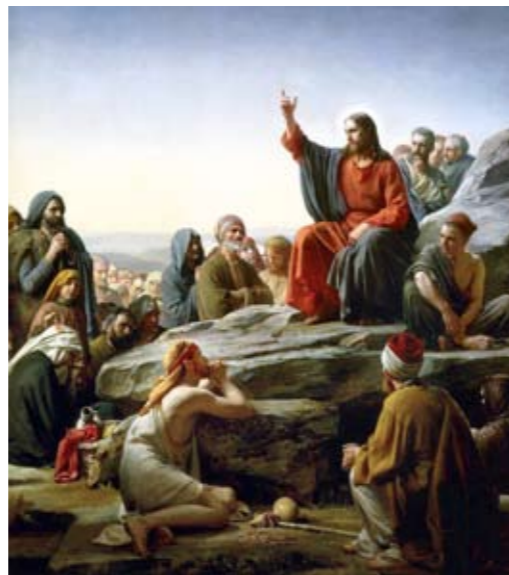
Карл Блох. Нагорная проповедь. (1890 г.)