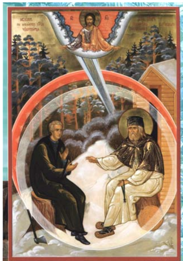
Беседа при Серафиме о стяжании Святого Духа, во время которой Царь Небесный, Утешитель, явил Себя дивному старцу и его гостю

15 января н.ст./2 января ст.ст. – преставление (1833), второе обретение (1991) мощей святого преподобного Серафима, Саровского чудотворца