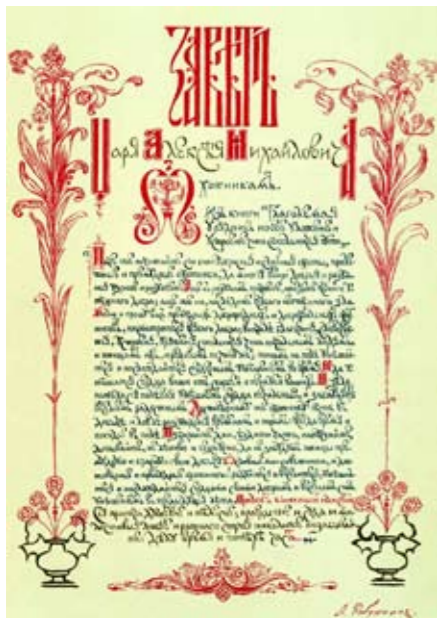
Андрей Рябушкин. Завет царя.