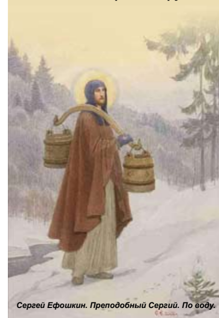
Сергей Ефюшкин. Преподобный Сергей. По воду.