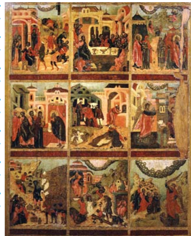
Заповеди Блаженства. Православная икона.

Хотел бы знать судьбу свою человек, хотел бы понимать: кто он, откуда и как ему следует поступать, переплетая нити в ткани собственной жизни. Однако он, даже и самый образованный учёный, видит: все его знания по сравнению с его невежеством – словно чаша воды рядом с открытым морем... Он желал бы превзойти добротой все другие существа в мире – но на каждом шагу низвергается в грязную лужу зла и жестокости... Он хотел бы всегда творить великие, гранди-