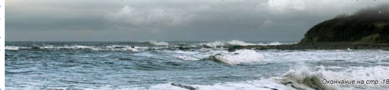
Окончание на стр. 18