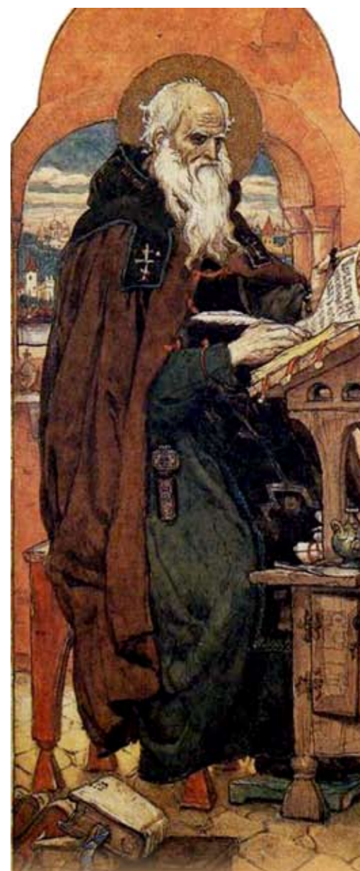
Виктор Васнецов. Нестор-летописец. (1912 г.)