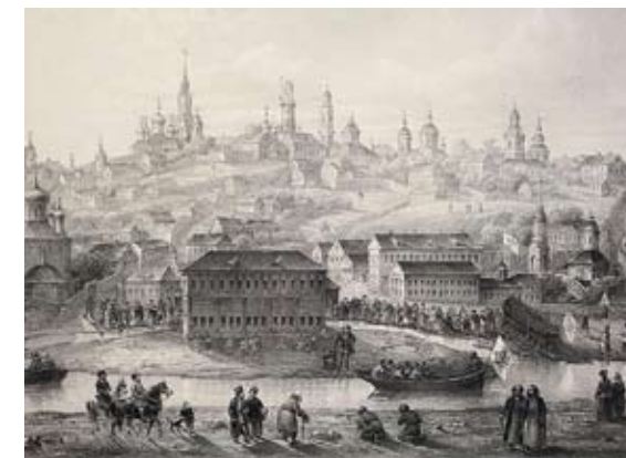
Воронеж. XVII век.