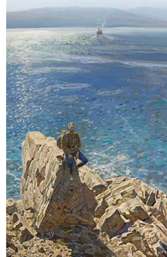
Павел Рыженко. Есаул. Фрагмент. (2008 г.)