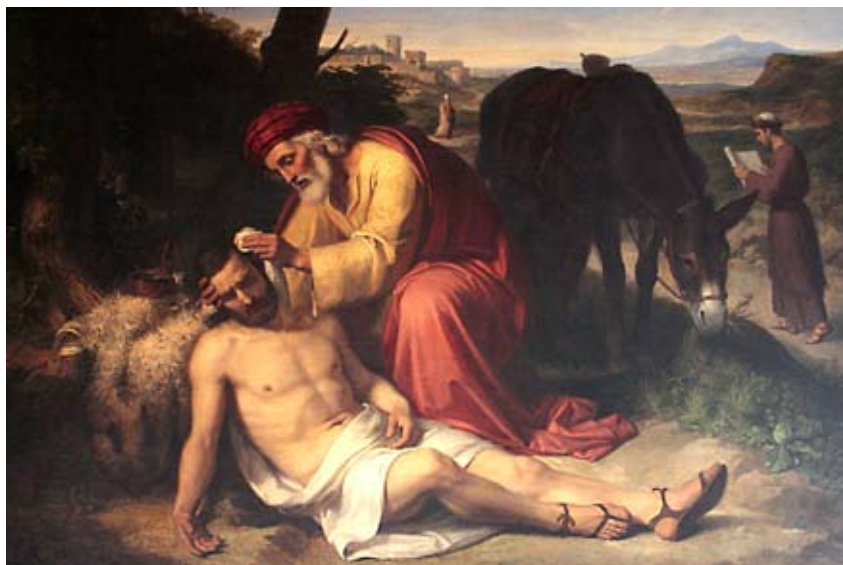
Пелегрин Клаве. Добрый самаритянин (1839 г.)