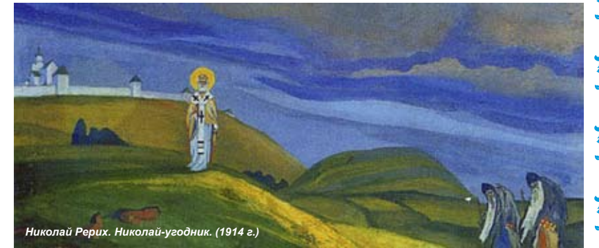
Николай Рерих. Николай-угодник. (1914 г.)

О святой Николай, Чудотворче! Мы помним и чтим твою доброту , явленную некогда одному семейству. Тогда ты тайно одарил отца приданым для трёх его дочерей и спас их от недоброй участи. И золото земное, отданное тобой, чудесно воссияло золотом Небесным в благодарной памяти наших сердец.