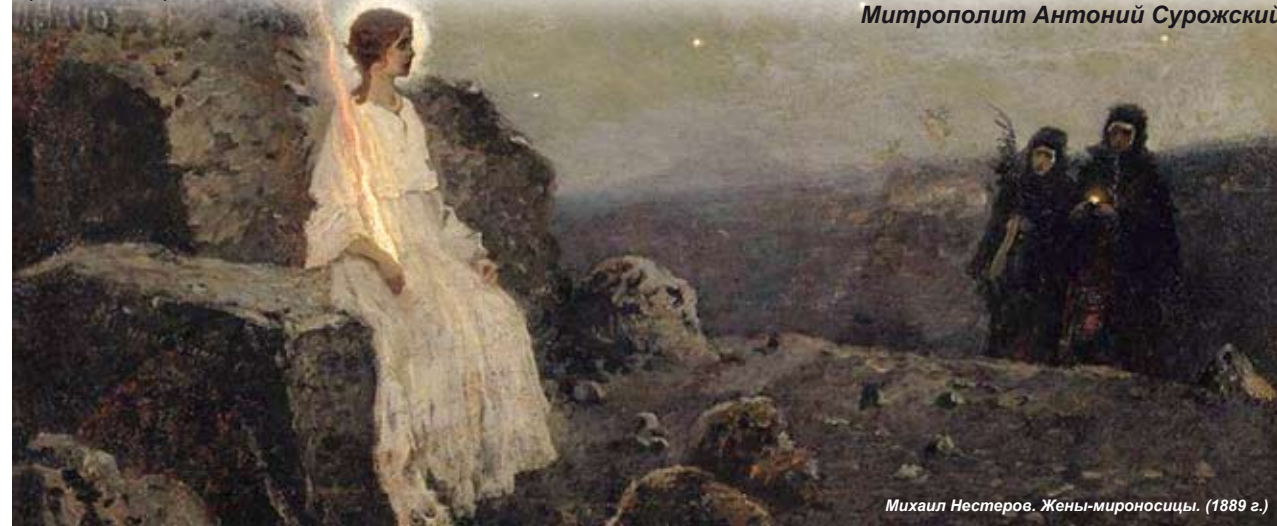
Митрополит Антоний Сурожский

Возвратясь в Иерусалим после погребения Иисуса, некоторые женщины, пришедшие с Ним из Галилеи, успели до захода солнца купить благовония. А Мария Магдалина, Мария Клеопова (она же Мария Иаковлева, как мать Иакова) и Саломия, вероятно, вернулись в Иерусалим несколько позже, когда торговля уже была прекращена, и потому только в субботу после захода солнца купили ароматические масла, чтобы, по обычаю еврейскому, помазать ими тело Иисуса и тем воздать Ему последний долг. Об этом повествует святой евангелист Матфей [Мф. 28, 1-15]. Купив ароматы, женщины эти, которых принято называть жёнами-мироносицами, не могли тотчас же тронуться в путь ко гробу, потому что наступила уже ночь. И ждали они рассвета, и казалась им эта ночь особенно длинной; и, не дождавшись конца её, рассчитывая на скорое наступление дня, они пошли ко Гробу Господню при свете полной луны. Между тем, в эту же ночь (в каком часу, неизвестно) свершилось величайшее из всех чудес: Христос Воскрес!