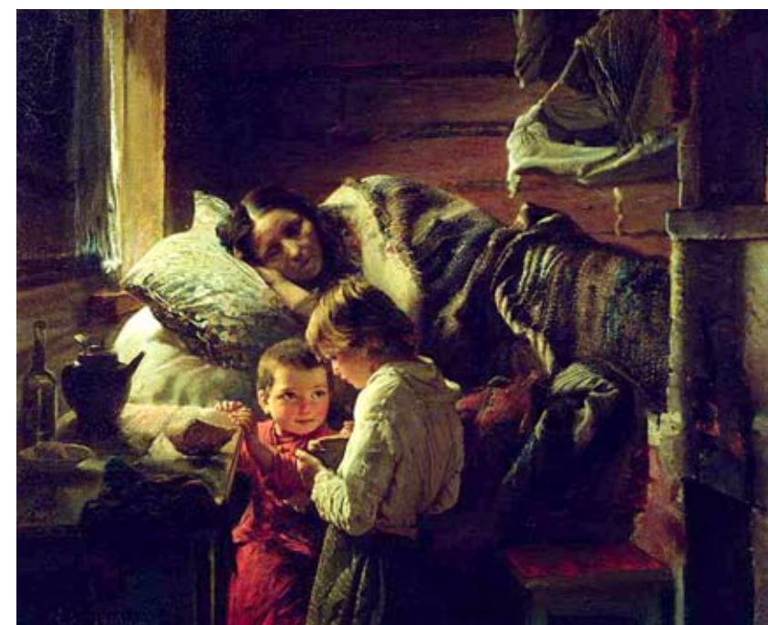
Алексей Корзухин. У краюшки хлеба. (1890 г.)

Забыл сказать: бабушка говорила на своём деревенском наречии, в войну они жили недалеко от Мурома, и, видимо, там так говорили. Её речь изобиловала подобными