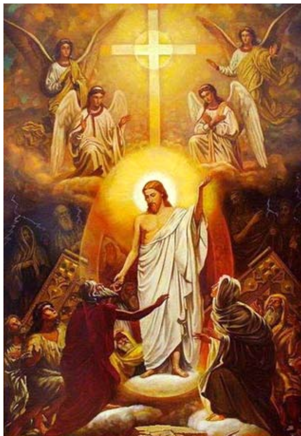
Яков Козлов. Сошествие во ад.