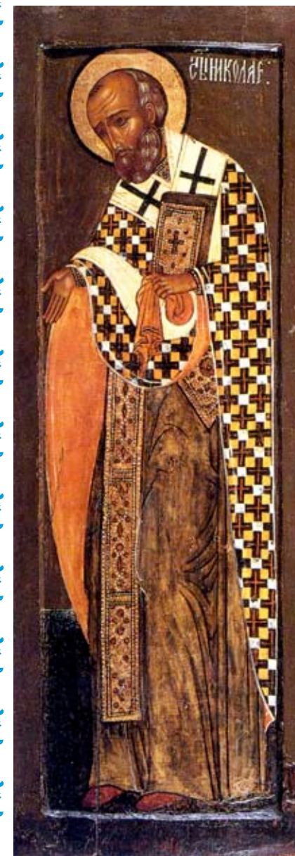
Свт. Николай Чудотворец. Мастерская Троице-Сергиева монастыря в Климентовской слободе. Первая половина XVII века. Икона деисусного чина.

О святой Николай, Чудотворче! Мы помним и чтим чудесные исцеления , дарованные через мир, источаемое твоими нетленными мощами в Баре. Тогда многие люди, пришедшие с верой к тебе, обрели избавление от телесных и душевных болезней. И стало это чудо свидетельством дарованной тебе Богом великой благодати исцеления. Да будем причастны твоей благодатью целительству наших ближних, и придём им на помощь во время болезней. Благословен Бог наш, и благословенна Его благодать в тебе, святой отче! Аминь.