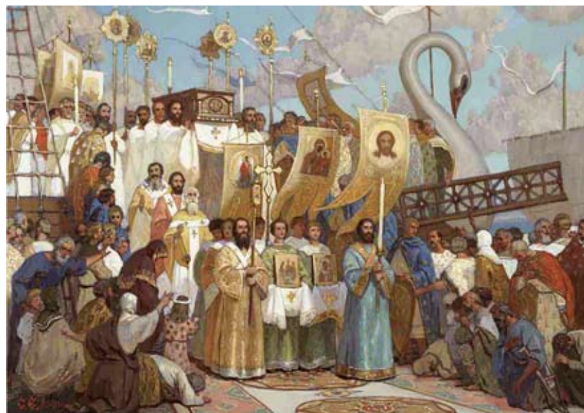
Сергей Ефошкин. Сретение святых мощей святителя Николая в Бар-граде.