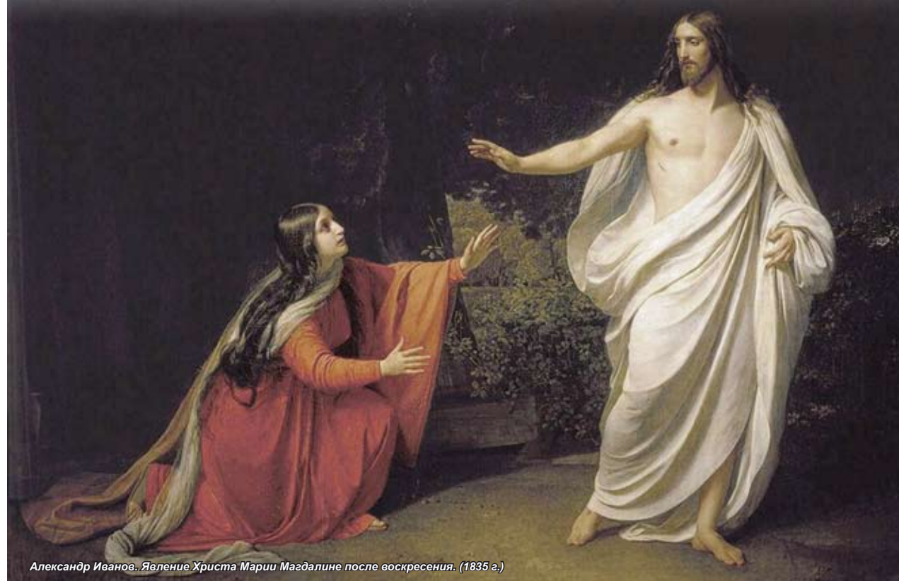
Александр Иванов. Явление Христа Марии Магдалине после воскресения. (1835 г.)

По беседе с профессором Алексеем Осиповым