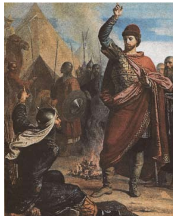
Фёдор Моллер. Отказ Александра Невского исполнить татарский обряд поклонения огню и кусту. (XIX в.)