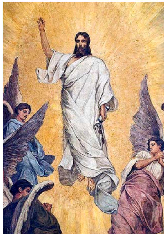
Виктор Васнецов. Радость праведных о Господе. Преддверие Рая. Средняя часть фрески. (1885 г.)