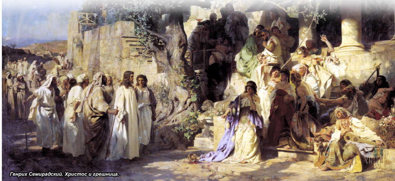
Генрих Семирадский. Христос и грешница.

Блаженный Феофилакт, архиепископ Болгарский