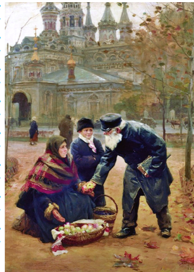
Николай Касаткин. Добрый дедушка. (1899 г.)

Преподобный Лука Елладский шёл однажды в поле сеять пшеницу и раздал её почти всю нищим, которым подать другого чего не случилось тогда у него, так что только остальную малую часть посеял. И что же?