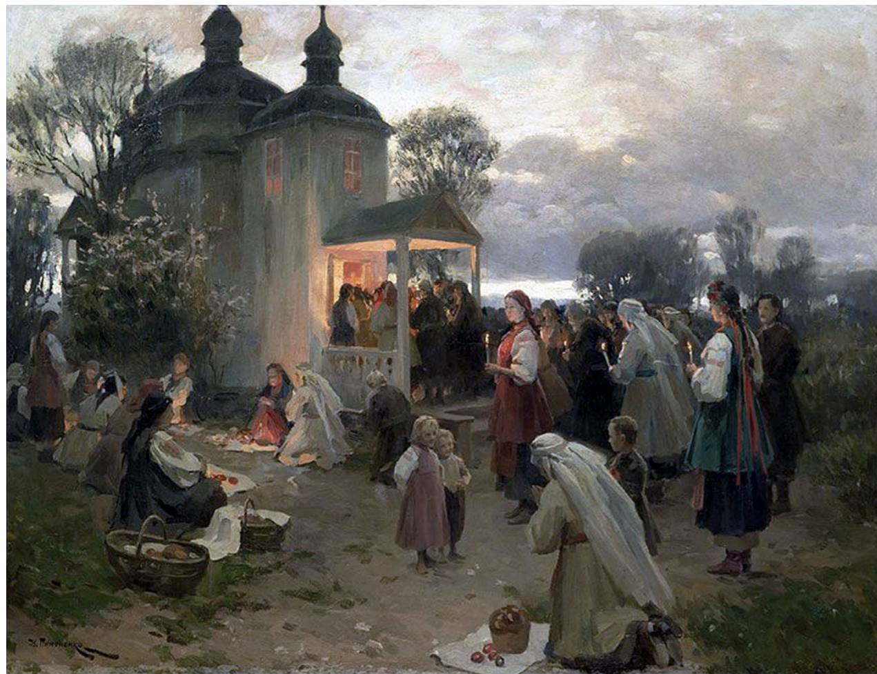
Николай Пимоненко. Пасхальная заутреня в Малороссии. (1891 г.)

Сегодня главный вопрос нашей жизни, нашей судьбы, нашего спасения вечного (и земного будущего наших детей) – это вопрос: «Воскреснет ли наша Россия?» Не первый год задаём мы его, не первый год Православная Церковь возносит ко Господу молитвенный вопль, надеясь и веруя, что воскресение совершится. «Давно, кажется, пора нам понять, что возможность положительного ответа на этот вопрос зависит всецело от нас самих, – писал в пасхальном послании, вышедшем в разгар антицерковных хрущёвских гонений, архиепископ Аверкий, духовный вождь русского православного зарубежья. – Россия воскреснет только тогда, когда мы сами, сыны и дочери её, сохранившие верность ей, как Святой Руси, воскреснем душами своими. Праздниками, беспочвенными останутся все наши надежды на воскресение России, если мы будем оставаться такими же, какими, по праведному Суду Божию, мы потеряли её... Ибо это мы сами, а не кто-либо другой, в первую очередь виновны в гибели нашей Родины. И теперь неразумно толковать о том, как спасти Россию, если мы