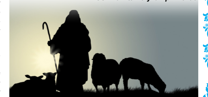
Святитель Лука Крымский

Запомните этот кондак. И помните всегда о дне Вознесения на Небо Господа Иисуса. Сердца свои устремите к Нему – ибо и нам надлежит вознестись вслед за Ним на Небо. Аминь.