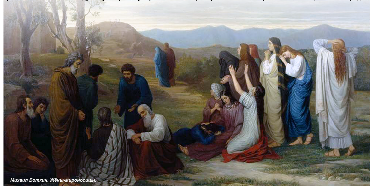
Михаил Боткин. Жёны-мироносицы.

Когда пришли дни испытаний, Спаситель говорил апостолам: «Да не смущается сердце ваше. Веруйте в Бога, и в Меня веруйте» [Ин. 14, 1]. Но даже они, любящие Христа, в миг опасности испугались и разбежались. С Господом остались лишь те, о ком почти ничего не повествуется в «Евангелии»: о голгофских событиях: тихие, скромные женщины, всюду ходившие за Христом и служившие Ему своими именами [Лк. 8, 1-3]. Теперь же, когда униженного и истерзанного пытками Христа как преступника вели на распятие, женщины были рядом.