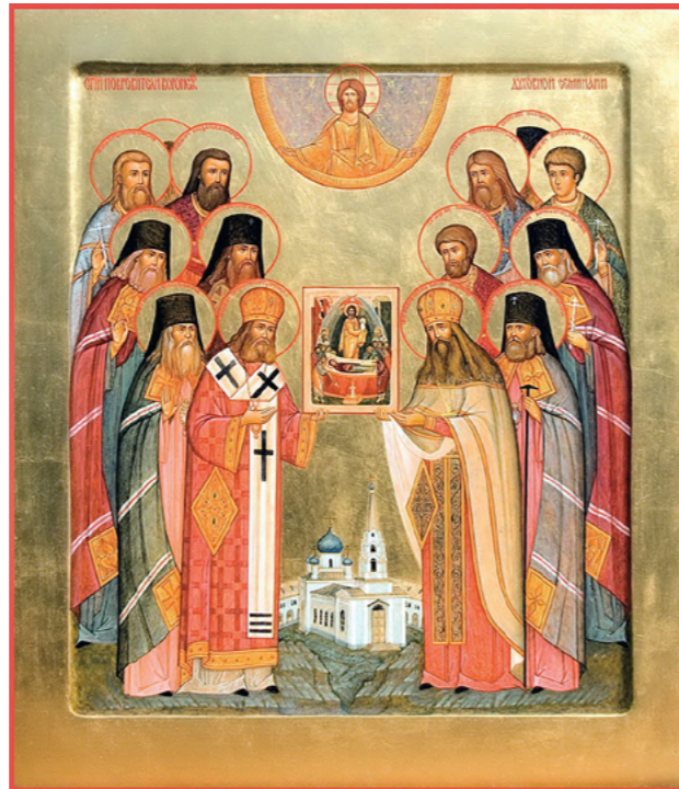
Икона «Собор Святых» Православной Духовной Семинарии. Среди них свт. Тихон Задонский, епископ Воронежский и Елецкий, свт. Антоний (Смирницкий), архиепископ Воронежский и Задонский.

Потрясение было настолько велико, что я зарыдал так громко, неудержимо, что меня принуждены были вывести из церкви... На все увещания, на все убеждения отца и матери, я, среди глухих всхлипываний, твердил только одно: «Живой святой и Ангелы живые!...». До могилы не забуду этого потрясающего события в моём детстве. И теперь даже, когда я вспоминаю о нём и живо себе представляю, и теперь ещё очень сильно впечатление, оставленное им в моей душе... Святые впечатления детства! Кто же вас может забыть?..