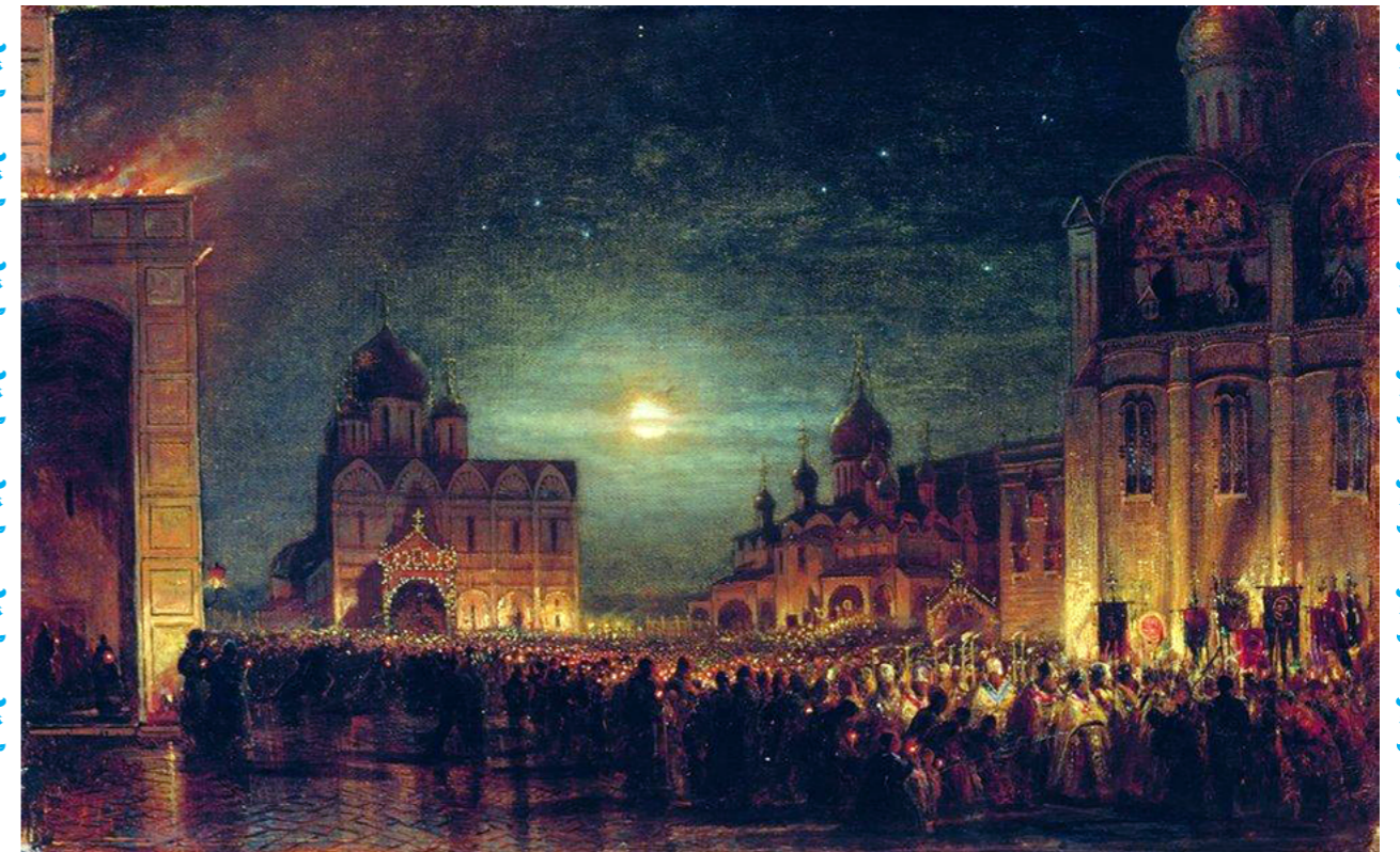
Алексей Боголюбов. Заутреня в Кремле.