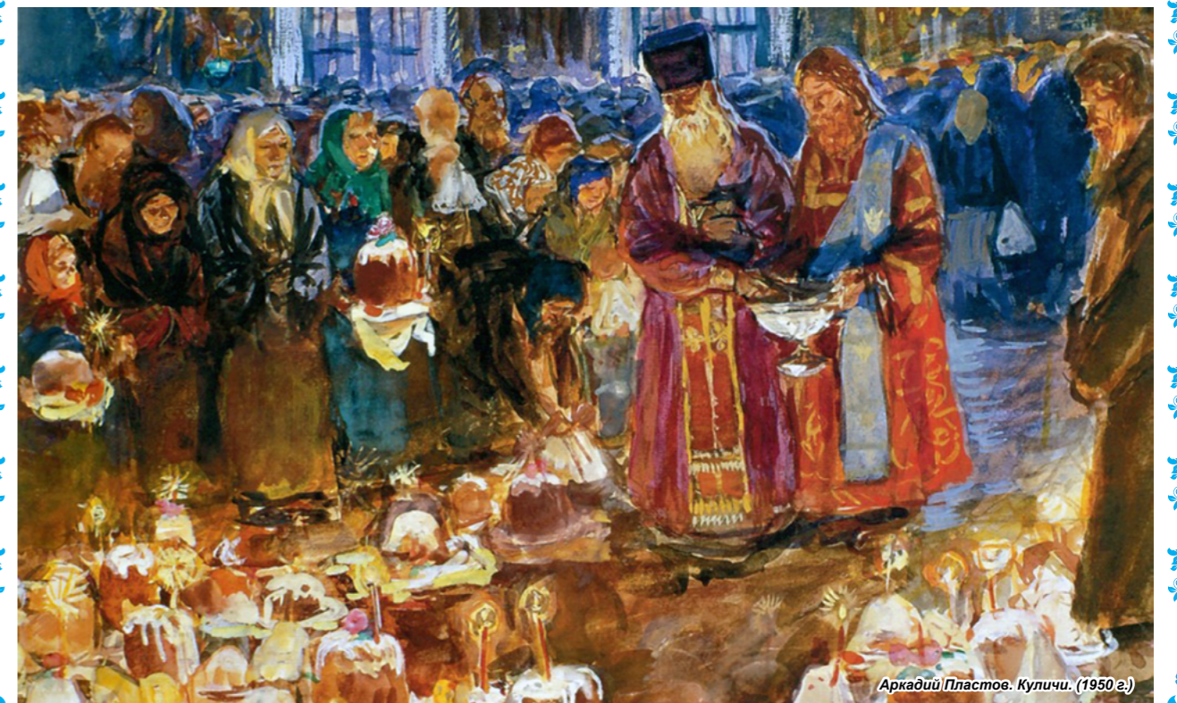
Аркадий Пластов. Куличи. (1950 г.)

Протоиерей Вахх Гурьев, благочинный 3-й гренадерской дивизии.