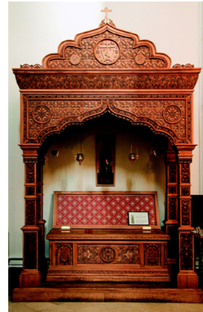
Рака с мощами св. князя Андрея Смоленского

После таких неопровержимых свидетельств о нетлении и чудотворении святые мощи благоверного князя торжественно положили в гроб, обвили плащаницей и совершили службу. Храм святителя Николая с того времени стали называть ещё храмом святого Андрея,