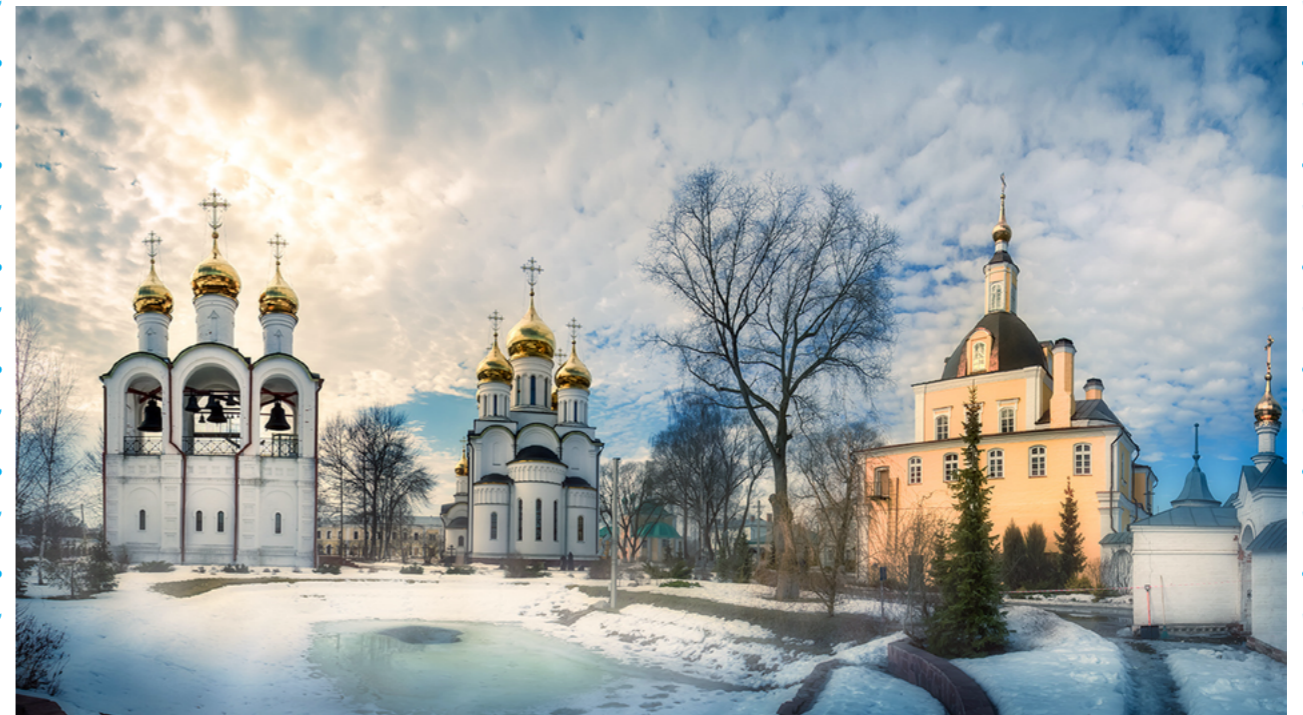
Переславский Свято-Никольский женский монастырь. Переславль-Залесский.

Наконец, в 1998 году по благословению Святейшего Патриарха монахинями Переславского Свято-Никольского женского монастыря были начаты работы по обретению честных мощей святого Андрея Смоленского. Монастырь этот расположен недалеко от места, где когда-то стоял Никольский храм, в котором князь Андрей служил пономарём. Мощи с остатками гроба-колоды нашли довольно быстро. Так они были обретены в очередной раз. Ныне святые мощи Андрея Смоленского почивают в резной раке Никольского монастырского собора в Переславле. Память Святого благоверного князя Андрея Смоленского (Переславского) – 9 ноября /н.ст./, в день обретения его святых мощей.