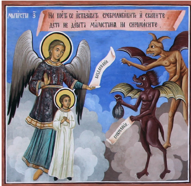
Мытарство седьмое, сребролюбия и скупости. Фрески Рильского монастыря, Болгария. Фрагмент.

Царь Давид незадолго до смерти так молился Богу: «Потому что странники мы пред Тобою и пришельцы, как и все отцы наши; как тень дни наши на земле, и нет ничего прочного. Господи Боже наш! всё это множество, которое приготовили мы для построения Дома Тебе, во славу святому Имени Твоему – от Руки Твоей оно, и всё оно – Твоё. Знаю, Боже мой, что Ты испытываешь сердце и любишь чистосердечие; я от чистого сердца пожертвовал всё сие; и ныне вижу, что и народ Твой... с радостью жертвует Тебе. Господи, Боже отцов наших! сохрани сие навек, сие расположение мыслей сердца народа Твоего, и направь сердце их к Тебе» [1Пар. 29, 15-18]. Давид просил Бога сохранить в народе Божиим непривязанность к земной жизни, способность и желание проявлять дух жертвенности в