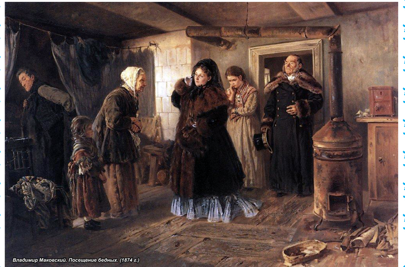
Владимир Маковский. Посещение бедных. (1874 г.)