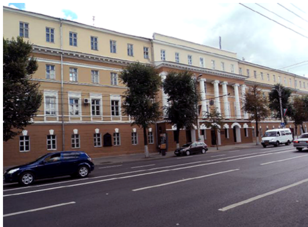
г. Воронеж. Бывшее здание духовной семинарии. Сейчас – колледж строительных технологий.