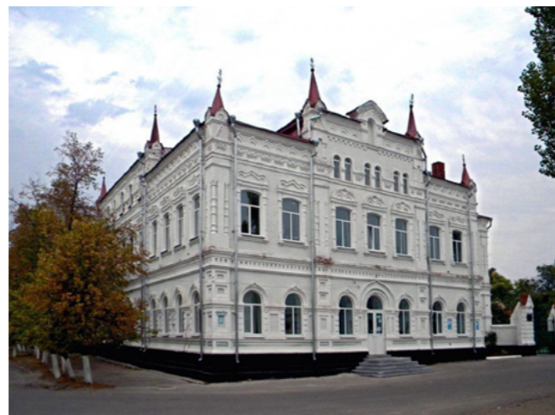
г. Павловск. Бывшее здание Павловского духовного училища. Ныне – Павловский аграрный техникум.

понятию «любовь» первоначальный, Божественный смысл. Описывая Гадаринское чудо, Сильченков с удивительной психологической точностью передал потрясение язычников от испытания их в «деле любви» к ближнему.