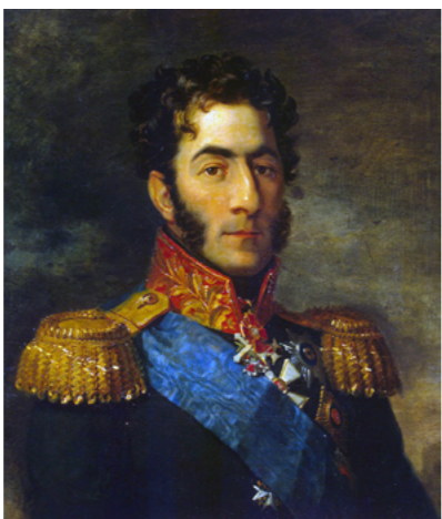
Джордж Доу. Портрет Петра Ивановича Багратиона. (Не позднее 1825 г.)

Маршал начал переговоры о перемирии, тем самым вызвав крайнее раздражение Наполеона. В своём знаменитом романе «Война и Мир» Лев Толстой отразил данный эпизод, процитировав текст письма Наполеона к Мюрату. В послании французский император выражает неудовольствие по поводу того, что маршал повёл переговоры без его согласия и приказания. К слову, Бонапарт тоже считал, что Мюрат сражался с основными силами Русской Армии, ибо упомянул в письме, что