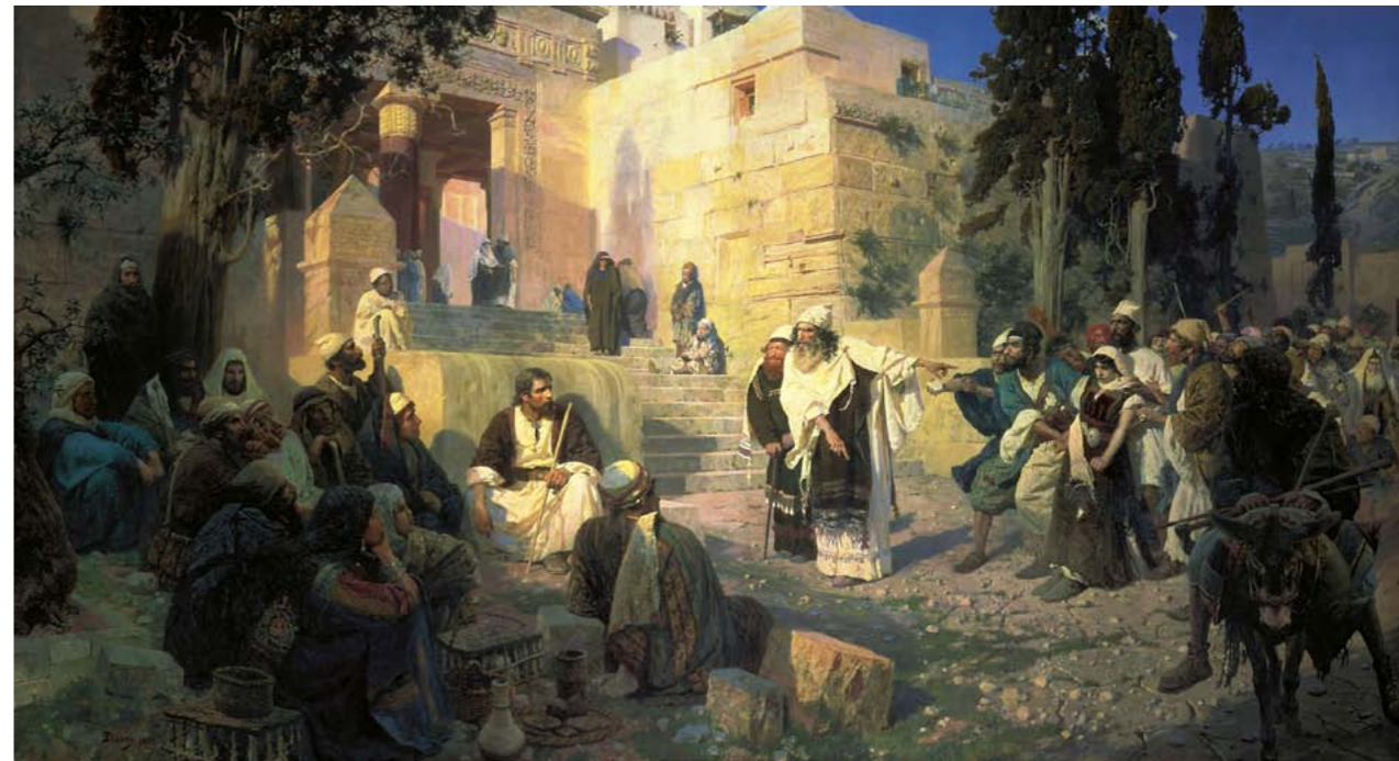
Василий Polenov. Христос и грешница. (1888 г.)