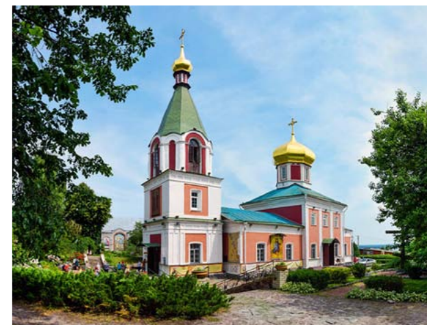
Церковь Бориса и Глеба. Вышгород.