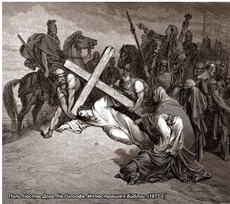
Поль Гюстава Доре. На Голгофе. Иллюстрация к Библии. (1877 г.)