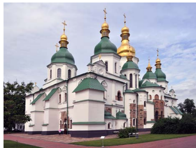
Софийский собор. Киев.

Из храмов, построенных при Ярославе вне Киева, вспомним новгородский Софийский собор. Подобно киевской Софии, новгородская София также сделалась кафедральным собором местных епископов. Кроме сооружения новых храмов князь заботился о возобновлении прежних. К примеру, восстановлением Десятинной церкви, созданной ещё равноапостольным князем Владимиром.