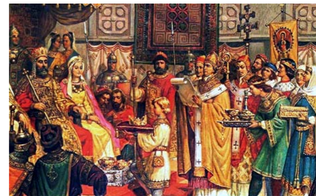
Французские послы у князя Ярослава.

Русь достигла в годы его княжения широкого международного признания. С семьёй киевского князя стремились породниться крупнейшие королевские дворы Европы. Сам Ярослав был женат на шведской