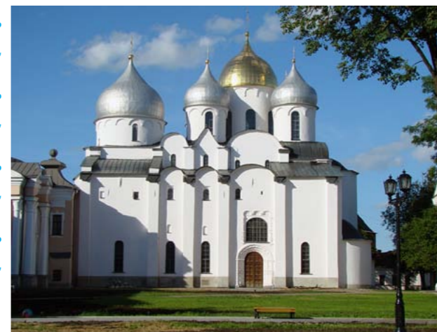
Софийский собор. Новгород.