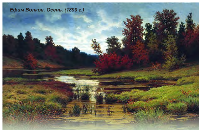
Ефим Волков. Осень. (1890 г.)

Восхищать силою Царство Небесное учиться у святых: как они подвизались, как употребляли над собою всякое усилие; какое у них было самоотвержение, какое беспристрастие к богатству, к мирской чести и славе, к плотским удовольствиям; какое имели воздержание, какое усердие к Богу, какую молитву всегдашнюю творили, какой труд, какое смирение,