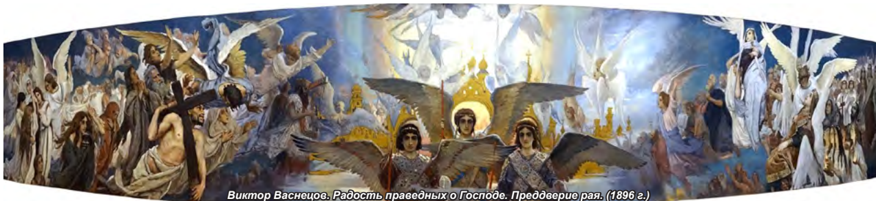
Виктор Васнецов. Радость праведных о Господе. Преддверие рая. (1896 г.)