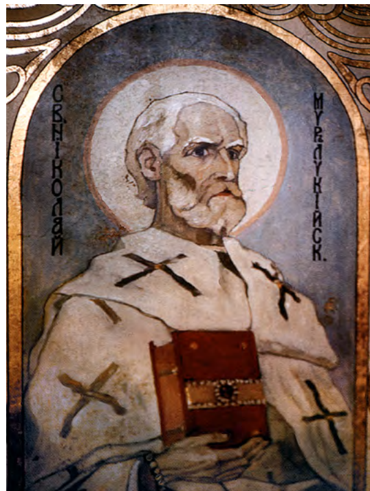
Михаил Нестеров. Святитель Николай. (1902-1903 гг.)

Родился будущий святитель в портовом городе Патары, который имел большое стратегическое и торговое значение (ныне – в пределах Турции). Назидаемый благочестивыми родителями, достойно провёл детские годы, с юных лет посвятил себя Церкви и стал впоследствии архиепископом Мир Ликийских (отсюда и его наименование – Мирликийский), там был и погребён. Он отличался скромностью и простотой; трудился, постился, молился; помогал всем – богатым и бедным, старым и юным, больным и здоровым и, самое главное, исцелял страждущих от греховных язв. В глубокой