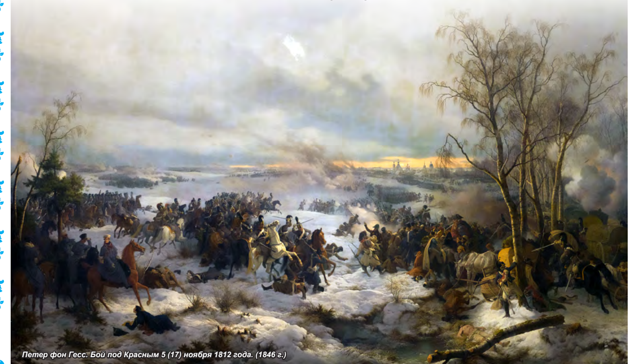
Петер фон Гесс: Бой под Красным 5 (17) ноября 1812 года. (1846 г.)