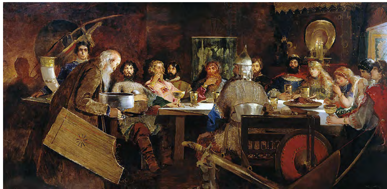
Андрей Рябушкин. Пир богатей у ласкового князя Владимира. (1888 г.)

одному крестьянину святым чудотворцем Николаем и о его соперничестве в этом деле со святым Илиею Пророком, и т.д.