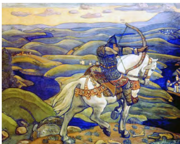
Николай Рерих. Илья Муромец. (1910 г.)

Ребёнок должен научиться переживать успех своей национальной армии как свой личный успех; его сердце должно сжиматься от её неудачи; её вожди должны быть его героями; её знамёна – его святыней. Сердце человека принадлежит той стране и той нации, чью армию он считает своей. Дух воина, стоящего на страже правопорядка внутри страны и на страже Родины в её внешних отношениях, отнюдь не есть дух «насилия» и «шовинизма». Без армии, стоящей духовно и профессионально на надлежащей высоте, Родина останется