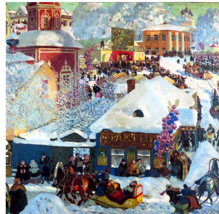
Борис Кустодиев. Зима. Масленичное гулянье. (1919 г.)