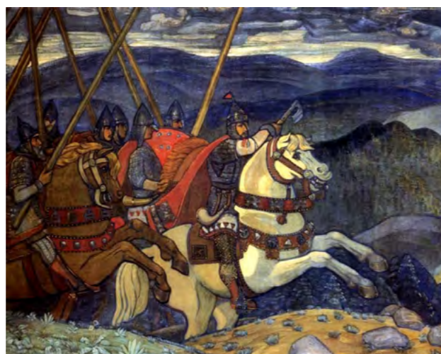
Николай Рерих. Вольга Святославич. (1910 г.)

без обороны, государство распадётся, и нация сойдёт с лица земли. Преподавать ребёнку иное понимание – значит, содействовать этому распаду и исчезновению.