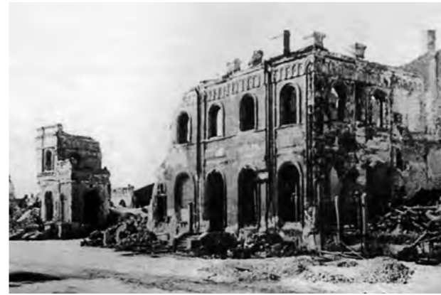
Воронеж летом 1942 года.