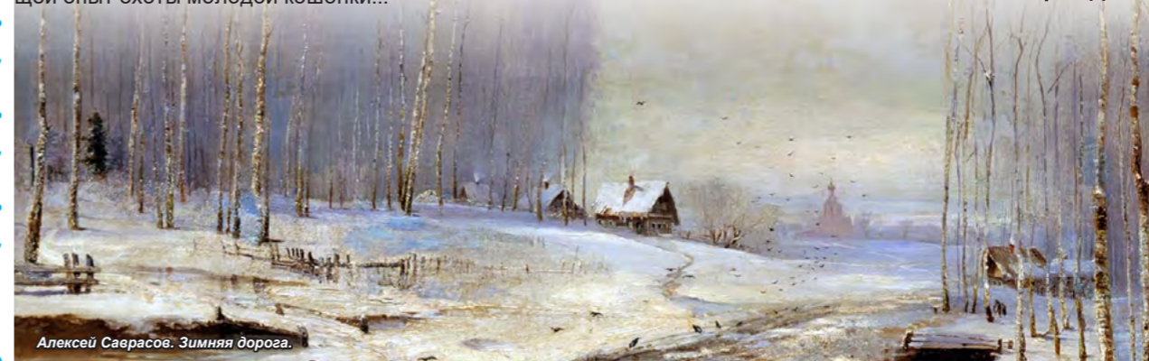
Алексей Саврасов. Зимняя дорога.