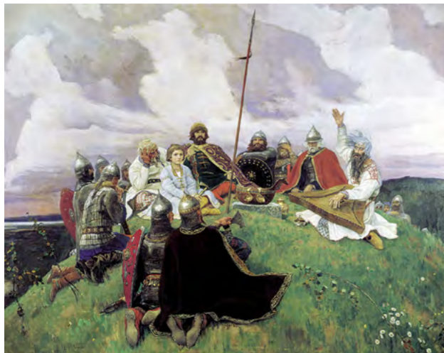
Виктор Васнецов. Баян. (1910 г.)

6. Поэзия. Стихи таят в себе благодатную силу: они, душу пленяя гармонией и ритмом, заставляют её прислушиваться к сокровенной жизни вещей и людей, побуждают её искать закона и формы, учат её духовному восторгу. Как только ребёнок начнёт говорить и читать, так классические национальные поэты должны дать ему первую радость стиха и постепенно раскрыть ему все свои сокровища. Сначала пусть слушает, потом пусть читает сам, учит наизусть, пытается декламировать – искренно, прочувствованно и осмысленно. Русский народ имеет единственную в своём роде поэзию, где мудрость облекается в прекрасные образы, а образы становятся звучащей музыкой. Русский поэт одновременно – национальный пророк и национальный музыкант. И русский человек, с детства влюбившийся в русский стих, никогда не денационализируется.