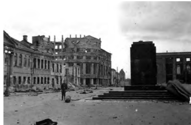
Площадь Ленина в дни оккупации. (Немецкое фото)

И все же фашисты – в Воронеже. Новая власть, иные порядки. Оккупанты действовали не только кнутом, но и пряником, и порой оба метода тесно переплетались.