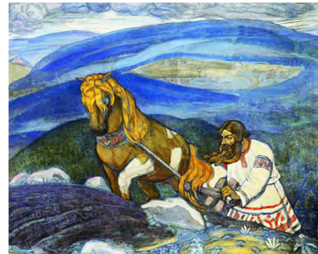
Николай Рерих. Микула Селянинович. (1910 г.)

10. Хозяйство. Ребёнок должен с раннего детства почувствовать творческую радость и силу труда, его необходимость, его почётность, его смысл. Он должен внутренне испытать, что «труд» не есть «блезнь», что работа не есть «рабство», что, наоборот: труд есть источник здоровья и свободы. В русском ребёнке должна проявиться склонность к добровольному творческому труду, и он должен почувствовать и осмыслить Россию как бесконечное и едва початое трудовое поприще. Тогда в нём пробудится живой интерес к русскому национальному хозяйству, воля к русскому национальному богатству как источнику