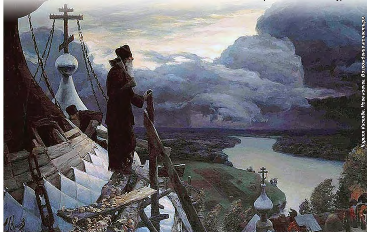
Кирилл Киселёв. Новое крещение. Возрождение монастыря.