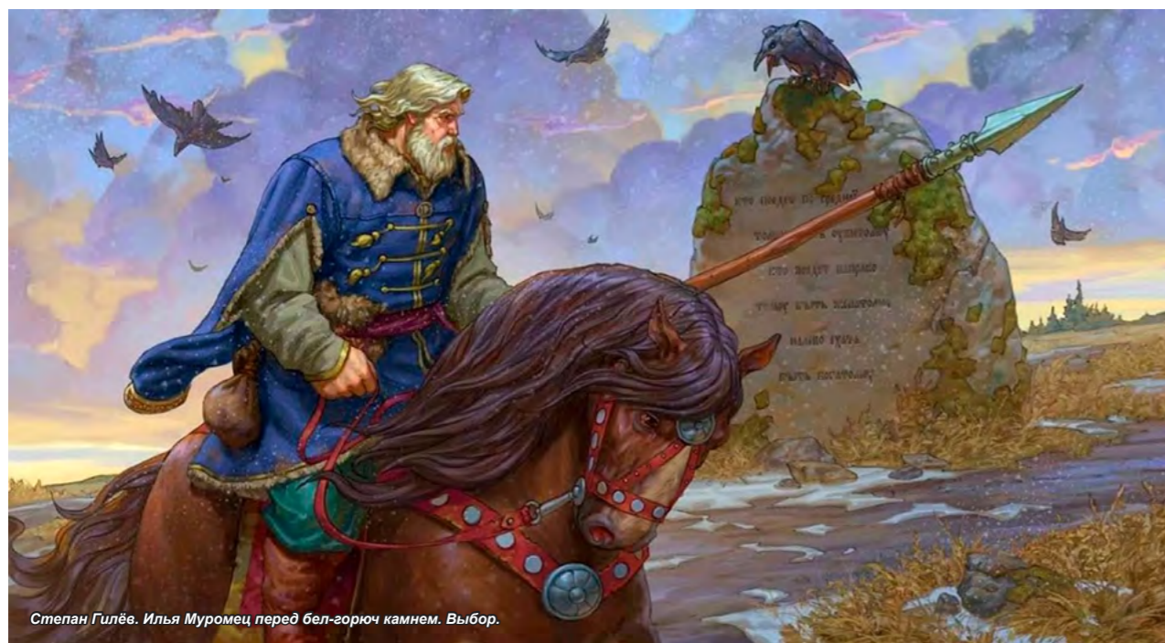
Степан Гилёв. Илья Муромец перед бел-горюч камнем. Выбор.

Если приятно бодрствовать и трудиться для блага и спокойствия семейства: как должно быть вождельно стоять на страже и в подвиге, для спокойствия и безопасности Отечества! Земная жизнь даётся человеку