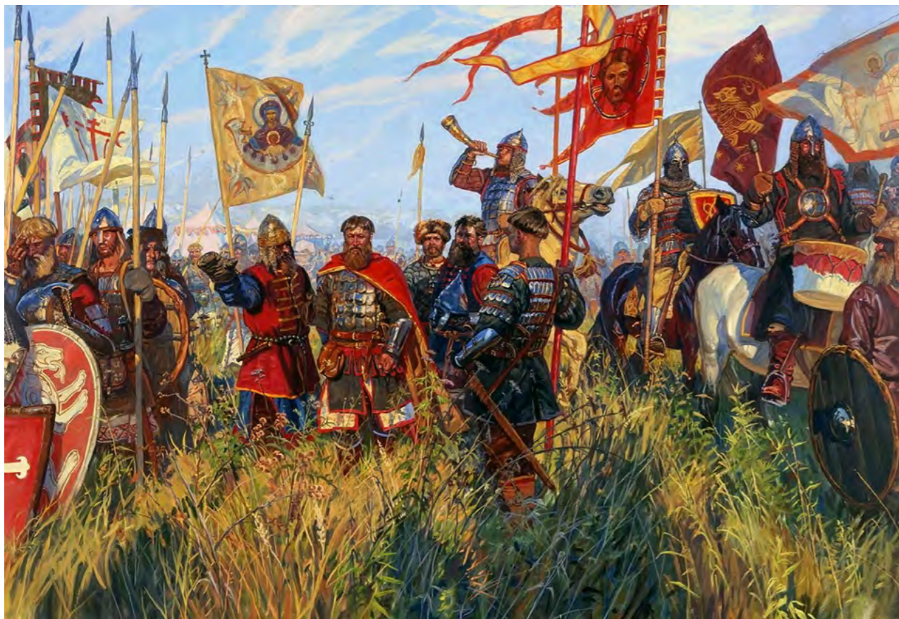
Максим Фаюстов. На поле Куликовом. (2010 г.)