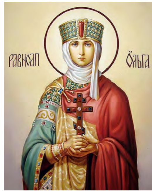
Святая равноапостольная княгиня Ольга, супруга великого князя Киевского Игоря

Соседние с Киевской Русью государства исповедовали религии, основу которых составлял монотеизм, то есть вера в единого Бога. В Византии господствовало христианство, в Хазарии – иудаизм, в Волжской Булгарии – ислам. Однако наиболее тесные связи существовали у Руси с христианской Византией.