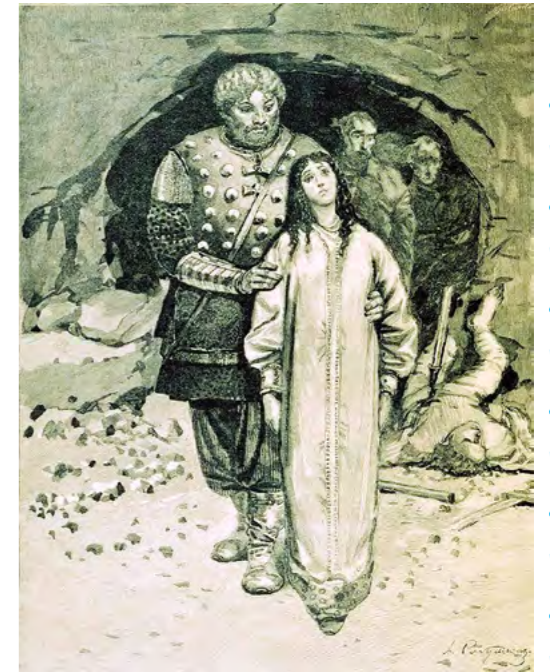
Андрей Рябушкин. Добрыня Никитич и сестра его Малуша (будущая мать князя Владимира). (1895 г.)

За крещением князя и его дружины последовало массовое крещение жителей крупнейших русских городов – Киева и Новгорода. А князя стали именовать Владимиром Крестителем . Важно, что универсальная письменность, пришедшая с принятием Православия на Русь, не только легла в основу церковного Богослужения, но также использовалась в государственной и гражданской жизни. Следствием крещения Руси в законодательной области стало разделение по византийскому образцу княжеской и церковной (митрополичьей, епископской) юрисдикции, которое древнерусская традиция также относит ко времени правления Владимира Святославича. В сфере церковного права оказались брачно-семейные отношения, преступления против нравственности, суд над клириками и членами их семей. Все эти установления нашли отражение в княжеских уставах X-XII века. Важнейшей задачей стало обеспечение соборных и приходских храмов русскими богослужебными книгами и грамотными священнослужителями, для чего детей знати целенаправленно отбирали «на учение книжное».