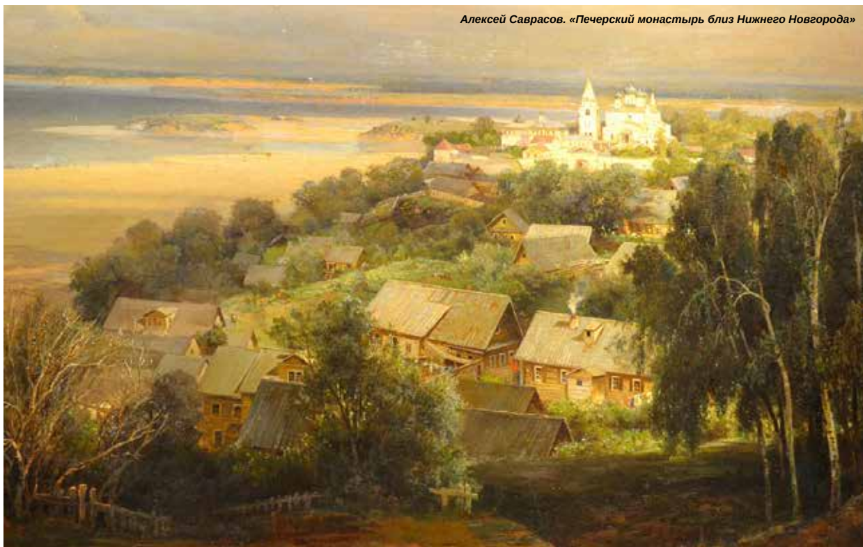
Алексей Саврасов. «Печерский монастырь близ Нижнего Новгорода»