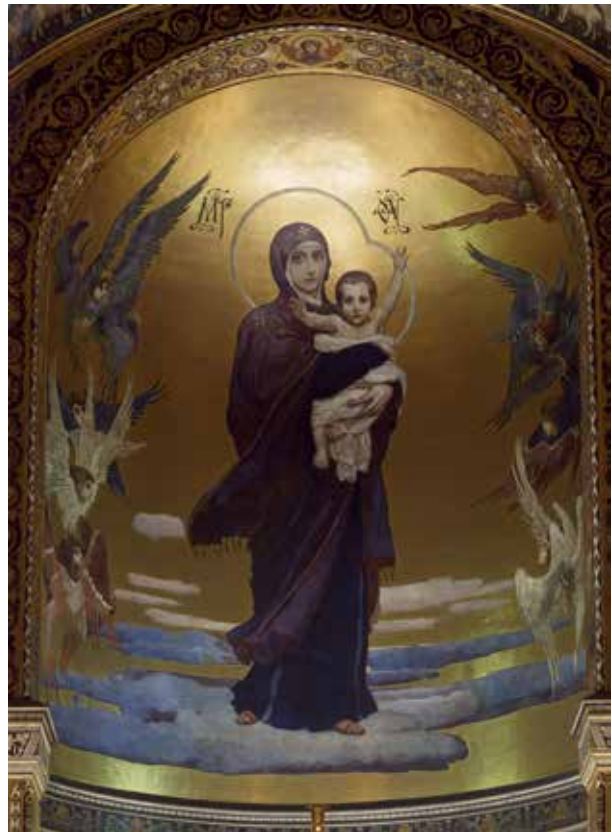
Виктор Васнецов. Богоматерь с Младенцем

Пред образом Благодатное Небо часто молятся о тех, кто заблуждается или впал в ересь. К образу также обращаются с просьбами: об исцелении от болезней и зависимостей; о замужестве и рождении