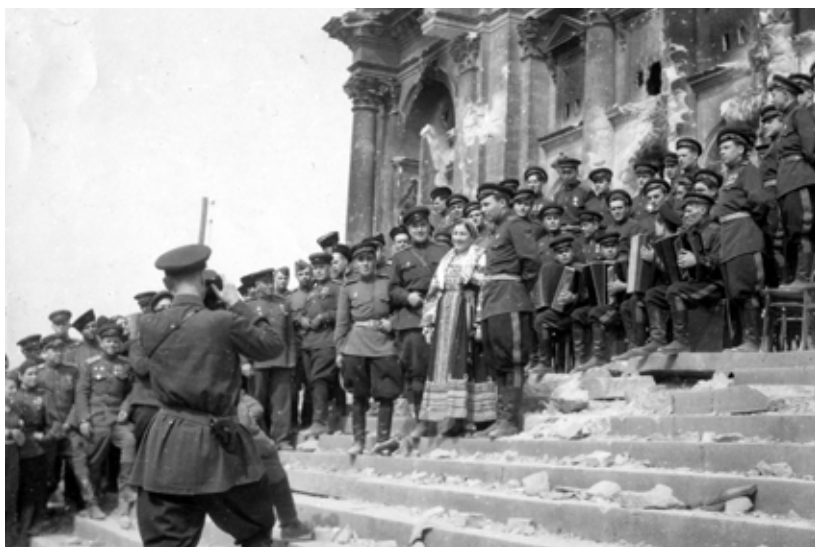
Концерт Лидии Руслановой на ступенях Рейхстага

Неостановим был русский вал! Не успели фашисты как следует осознать потерю Кёнигсберга, а Красная армия уже стучалась в ворота Вены, где местными жителями втайне готовилось восстание против нацистов, однако нашлись предатели, выдавшие гитлеровцам штаб повстанцев.