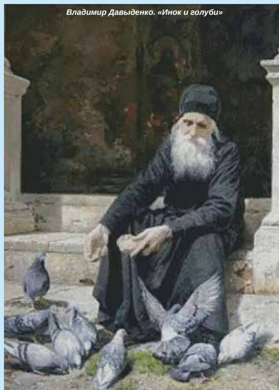
Владимир Давыденко. «Инок и голуби»