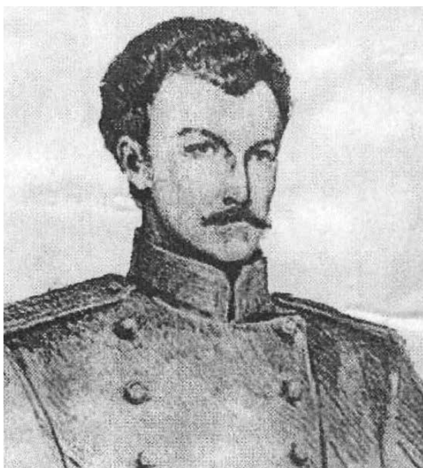
Портрет Дмитрия Брянчанинова в офицерском мундире

Решаясь отойти от мира «для усвоения Христу», юноша понимал, что его частые простуды, капризный желудок и «барское» воспитание усложнят пребывание в монастыре. Но самоотверженно просил Господа дать ему сил всё перетерпеть, исполнить волю Божию как «долг непрременный». Весной 1826 года последовала внезапная болезнь – чахотка (тяжёлая форма туберкулёза), от которой, несмотря на неблагоприятные прогнозы, Брянчанинов излечился. Она и помогла несколько позже ему освободиться от немилостивого ему натуре мирского поприща. Недуг забирает силы молодого офицера, он готовился к переходу в вечность. И когда вдруг стал поправляться, решил