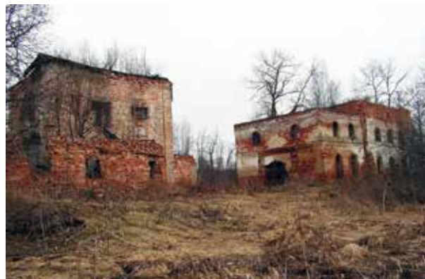
Григорие-Пельшемский Богородицкий Лопотов монастырь. Слева – конец XIX века. Справа – конец XX века.