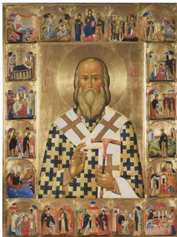
Икона свт. Игнатия (Брянчанинова)