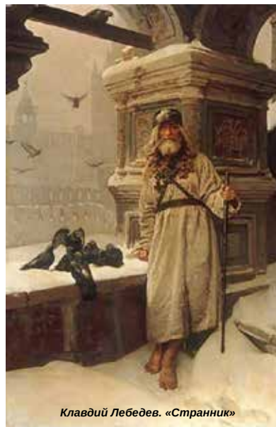
Клавдий Лебедев. «Странник»