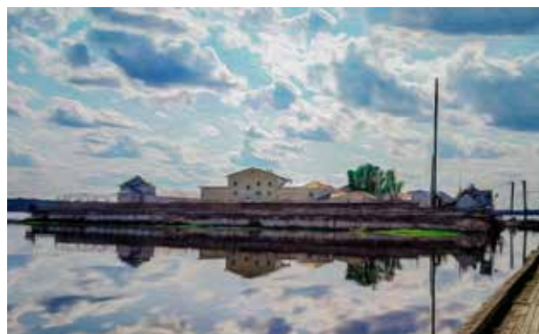
Кирилло-Новозерский монастырь в честь Воскресения Христова. Слева – конец XIX века. Справа – первая четверть XXI века. «Вологодский пятак» на Огненном острове – Колония №5 в стенах поруганного Кирилло-Новозерского монастыря.