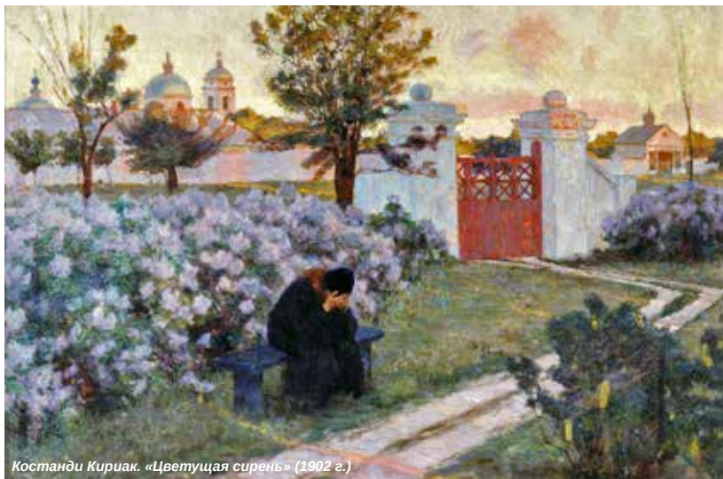
Костанди Кириаки. «Цветущая сирень» (1902 г.)

Использованы материалы Православного женского журнала «Славянка» № 3(69) 2017 г.