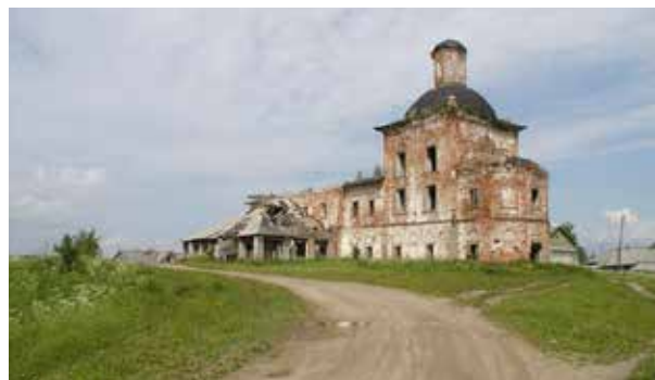
Дионисиево-Глушицкий Покровский монастырь. Слева – конец XIX века. Справа – конец XX века.