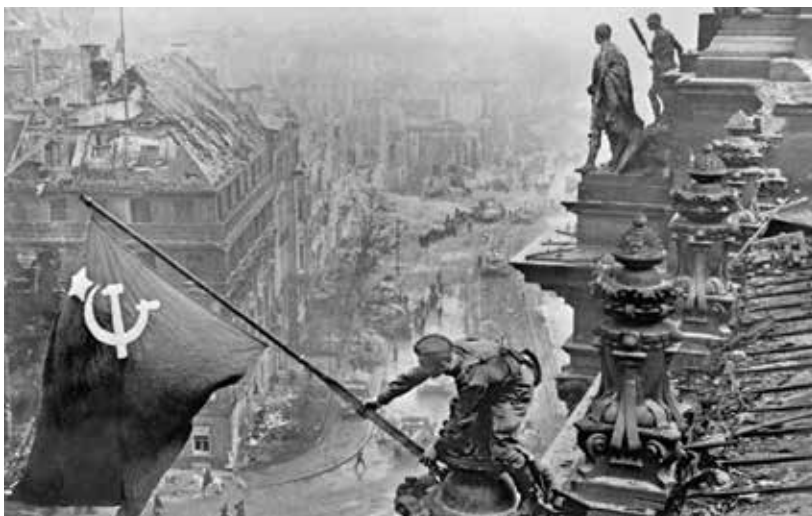
Водружение знамени над Рейхстагом.

На фронте миг – это прожитая жизнь. К Великой Победе шли долгие четыре года, а в последние весенние месяцы уже никто и ничто не могло остановить Красную Армию. К концу марта одной из важных задач являлась освобождение главного города Словакии Братиславы – дунайского «ключа» от Восточной Европы. В ходе начавшейся 26 марта Братиславско-Брновской наступательной операции 2-я Украинская армия под командованием маршала Родиона Яковлевича Малиновского на чехословацкой земле за короткий срок освободила около двухсот сёл и городков. В ходе боёв блестяще показали себя казаки генерала Иссы Александровича Плиева, лихими и ошеломляющими действиями наводившие на врага ужас.