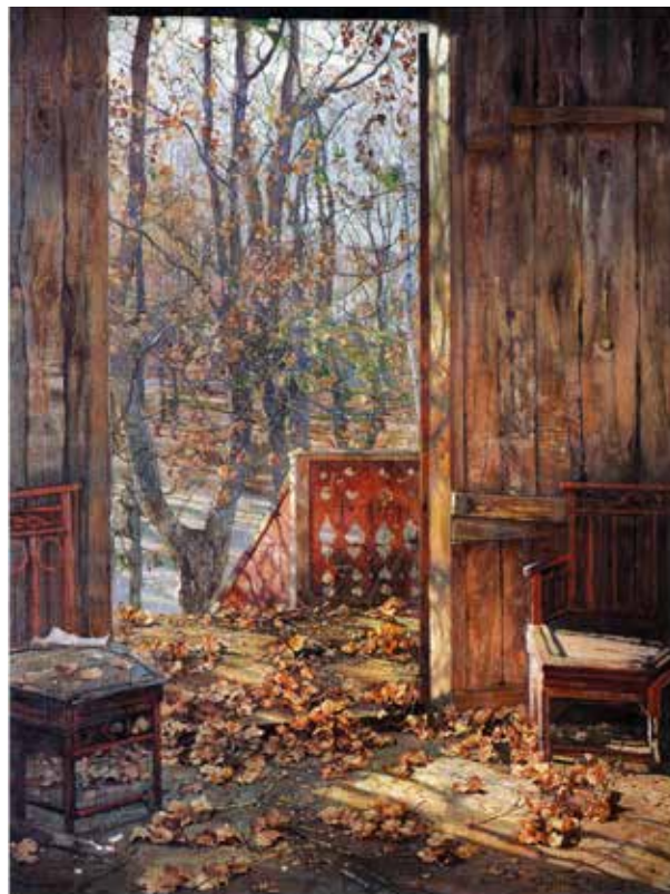
Исаак Бродский. «Опавшие листья»

Под утро я увидел во сне вдалеке яркую серебристую точку. Она медленно приближалась ко мне, пока не приняла вблизи очертания человека в белом одеянии до пят. Только лицо его было неразличимо. Я взволнованно напрягся. Он с кроткой улыбкой пригляделся ко мне.