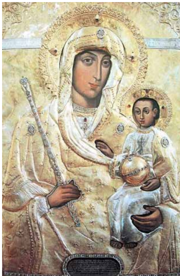
Минская икона Богоматери

Управлял Десятинной церковью Анастас Корсунянин – один из новых приближённых Владимира, и он, по мнению некоторых исследователей, сыграл