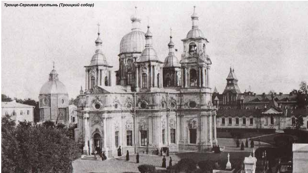
Троице-Сергиева пустынь (Троицкий собор)