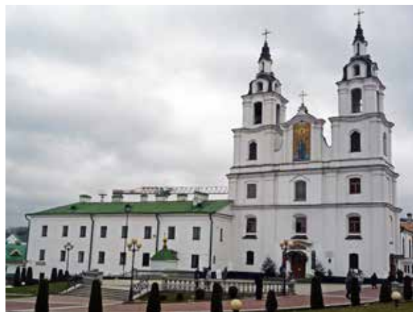
«Свято-Духов кафедральный собор в Минске»