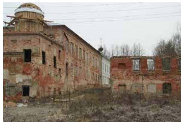
Никола-Бабаевский монастырь. Слева – конец XIX века. Справа – конец XX века.