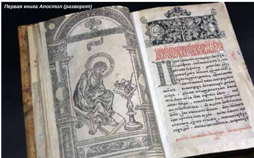
Первая книга Апостол (разворот)

что древнерусский алфавит имеет более раннее происхождение, а солунские братья Кирилл и Мефодий лишь упорядочили и систематизировали его. Может быть и так. Абсолютно точно, что нет вразумительного ответа на вопрос, почему «неграмотная» Русь в одночасье вдруг феноменально расцвела в книжной премудрости и оказалась впереди всей Европы. Да и найденная запись новгородского священника Упыря Лихого о том, что в 1047 году он переписал глаголическую рукопись, подтверждает, что рукописные книги на русских землях имели давние традиции.