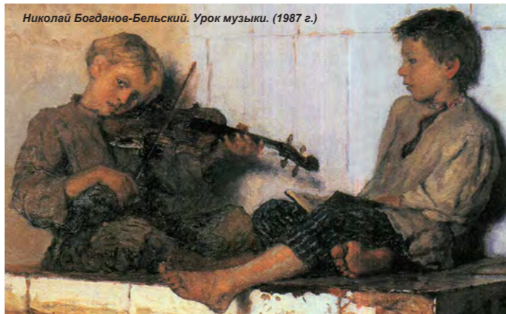
Николай Богданов-Бельский. Урок музыки. (1987 г.)

«Вот я вырезаю по дереву. Это удается мне потому, что я владею моим скобелем и могу делать с деревом все, что захочу. Поэтому я могу вложить в мою резьбу все мое сердце и показать людям, какая бывает на свете нежная красота и радость».