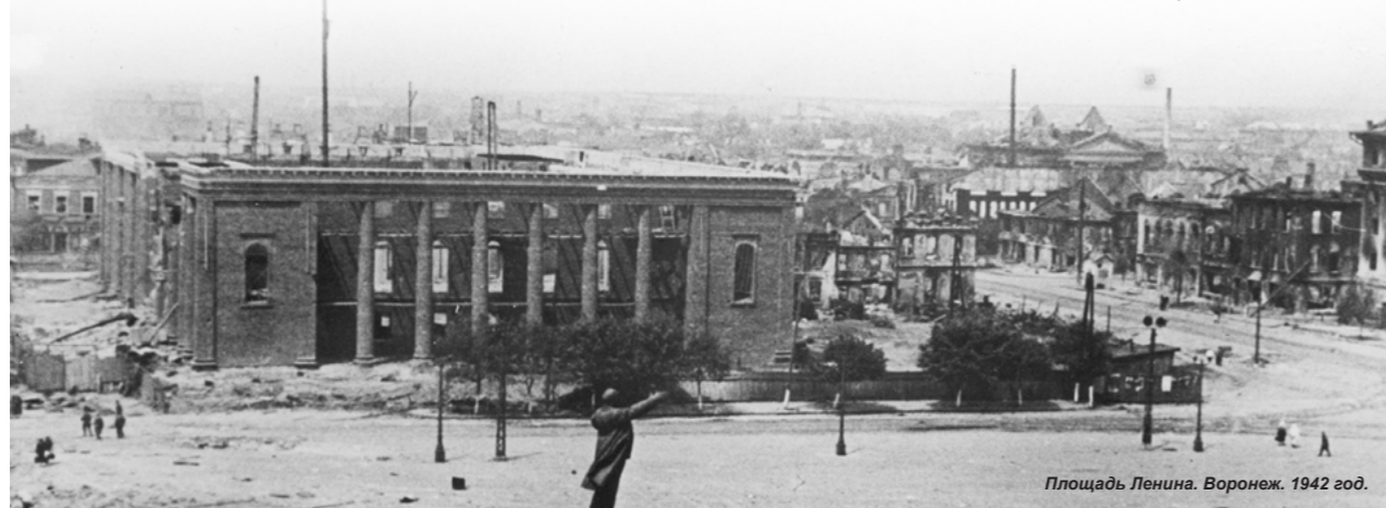
Площадь Ленина. Воронеж. 1942 год.