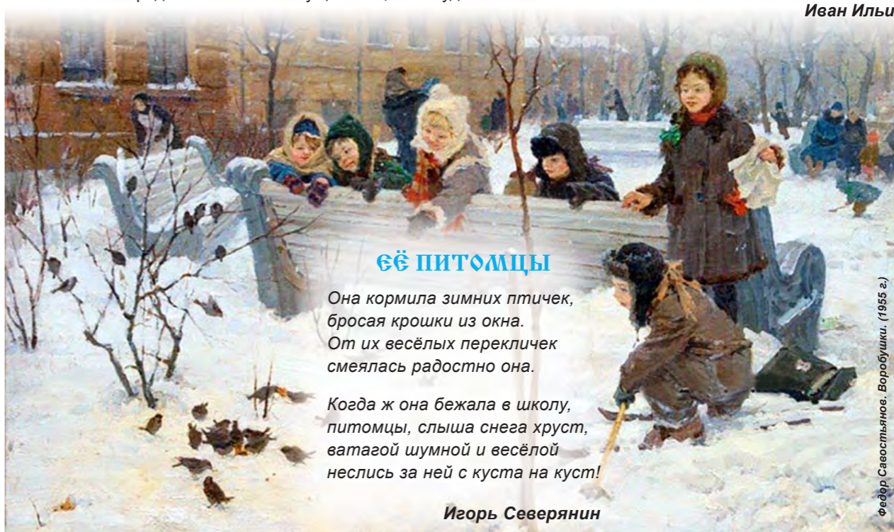
Игорь Северянин. Воровушки. (1955 г.)