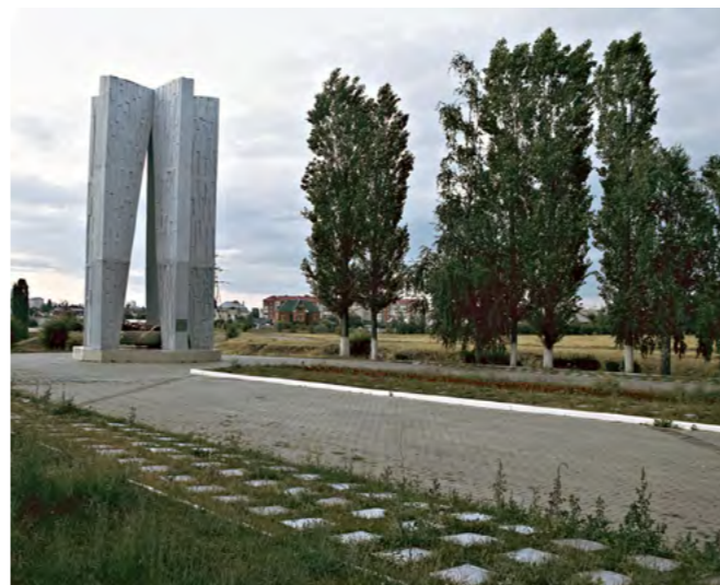
Мемориал «Песчаный лог».

Конвоир отвернулся, сделал вид, что не заметил – и мама с Леной, с сестрой и её детьми сумели уйти. Шли с опаской, добрались до Курбатова – а там хозяйничают немцы!.. У нацистов с документами строго,