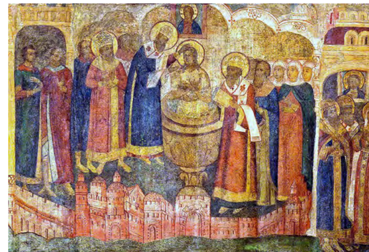
Крещение княгини Ольги в Константинополе.

Да, русы показали несокрушимость и мощь нашего оружия. В чужой земле Святослав сражался одной лишь дружиной, без обозов и резервов, с превосходящими их по численности закалёнными византийскими легионами. Слава и честь спасены. Мир! Но не победа. Царьград устоял. Святослав показал, что его путь ярок и героичен – но он не приведёт к успеху. Без внутреннего стержня Веры, без вдохновляющей идеи Святослав добился максимума. И всё же был обречён. Святослав, кстати, хотя наотрез и отказался принять христианство, не запрещал креститься