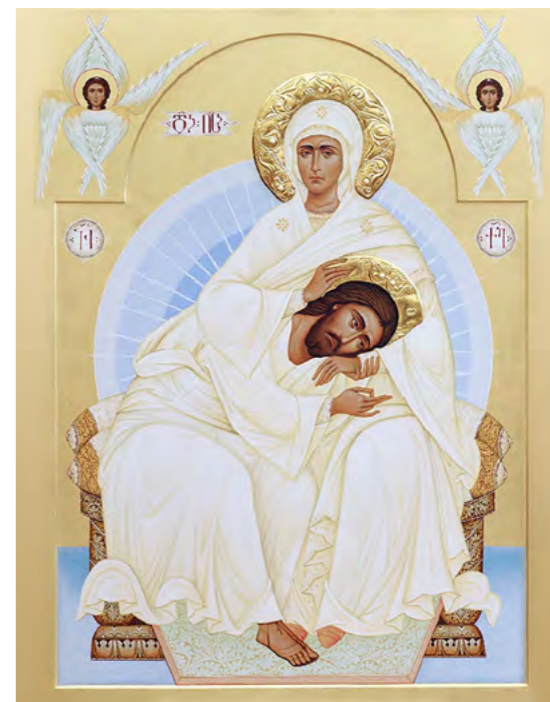
Матерь Смирения. Иконописный образ создан в Грузинской Православной Церкви в 2021 г.

Познавая себя, мы обретаем Бога, и на этом пути следовало бы постоянно напоминать себе слова великого подвижника архимандрита Иоанна (Крестьянкина): «Но настало уже такое время, которое отменяет все надежды на человеческое и указывает миру единую опору, единую надежду – на Бога. Древние отцы великими своими подвигами дошли до этой истины. Они сознательно брали на себя тяжести и горечи подвигов болезней и самоотречения. Нашему времени эта истина даётся от Бога без нашего вмешательства, даётся очевидно, зримо. Духовникам и чадам Божиим остаётся только понять, что сила их не в подвигах, не в учёности, но в немощи, которую надо принять как свою спасительницу, примириться с ней, полюбить её и сознательно принести свою немощь к Стопам Божиим, чтобы в ней начала действовать Благодать и Сила Божия и возоблился в нас Христос».