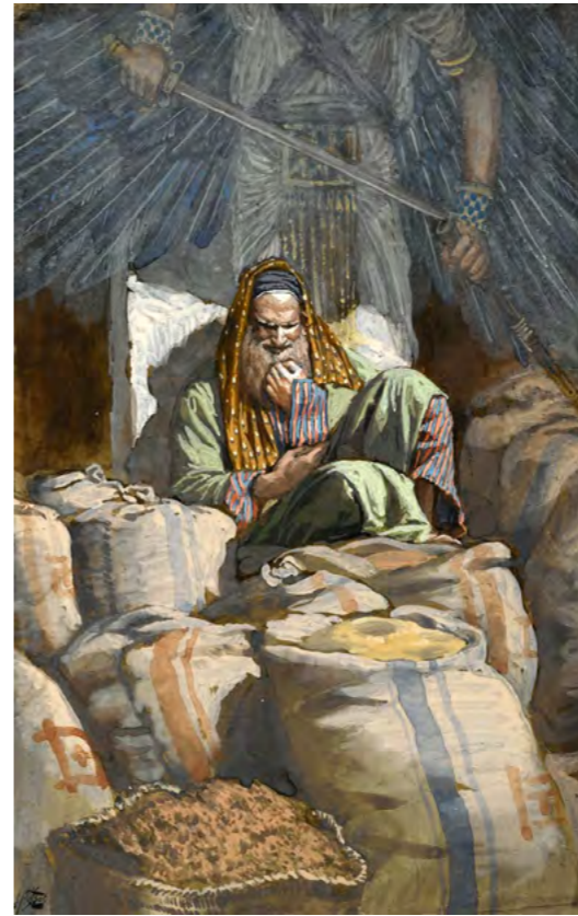
Джеймс Тиссо. Притча о неразумном богаче.

Отдавая своё сердце земным сокровищам, человек становится их рабом. Для пояснения вреда, который приносит порабощение сердца попечением о земных вещах, в том числе о богатстве, Христос приводит в пример наше телесное око [Мф. 6, 22-23]: в здоровом состоянии оно правильно воспринимает вещественный свет, благодаря чему человек получает правильное представление о своем теле и о всех предметах и даёт им правильную оценку, а при повреждении ока происходит обратное явление. «А что значит глаз для тела, то значит и ум для души», – поясняет святой Иоанн Златоуст. Светлый ум ясно понимает духовные предметы и всю