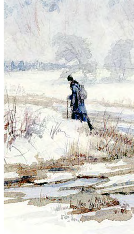
Странник. По акварели Алии Нуракишевой, 2012 г.