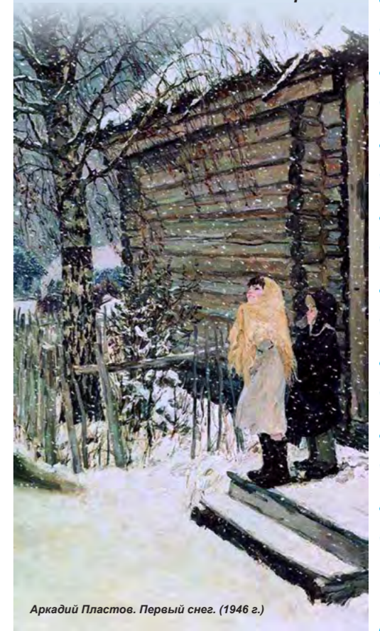
Аркадий Пластов. Первый снег. (1946 г.)