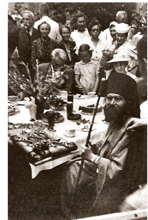
День ангела епископа Иоанна. Шанхай, 1943 г.

будет темно». В храме действительно оказалось совсем темно, там оставалась непотушенной только одна лампадка. Так как уже все разошлись, владыка Иоанн предложил проводить меня до школы. Он несколько раз спрашивал, настаивал. Но я всё время отказывался, причём я отчётливо тогда понимал, что это гордость во мне говорит, и мне стало очень стыдно. Но я смог себя превозмочь и всё равно отказывался, и Владыка меня ласково отпустил одного. При выходе стоял мой старший однокашник, мальчик лет девяти, он ругал меня всю дорогу, что я задержался, а его заставили меня ждать. Он ожидал, что его насмешки заденут меня и я буду плакать, и очень удивился, что меня это больше не тревожило – такое радостное ощущение у меня было. Эту свою исповедь я запомнил на всю жизнь.