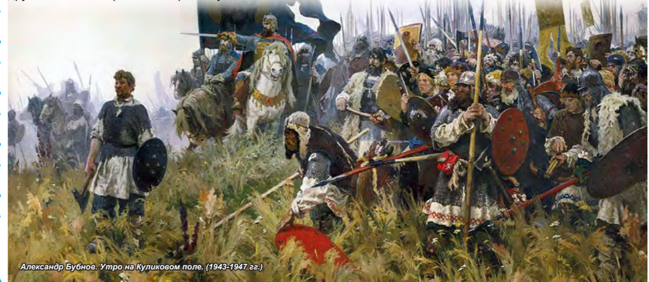
Александр Бубнов. Утро на Куликовом поле. (1943-1947 гг.)

Иссечённый, плавал в собственной крови ближний друг Димитрия Московского Михаил Бренок. На Куликовом поле великий князь, облачённый в доспехи простого ратника, наравне с дружинниками бился в жестокой сече. В княжеские одежды он снарядил своего друга – Михаила Бренка и вверил ему Московский стяг.