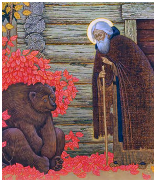
Александр Простев. Преподобный и медведь. (2001 г.)