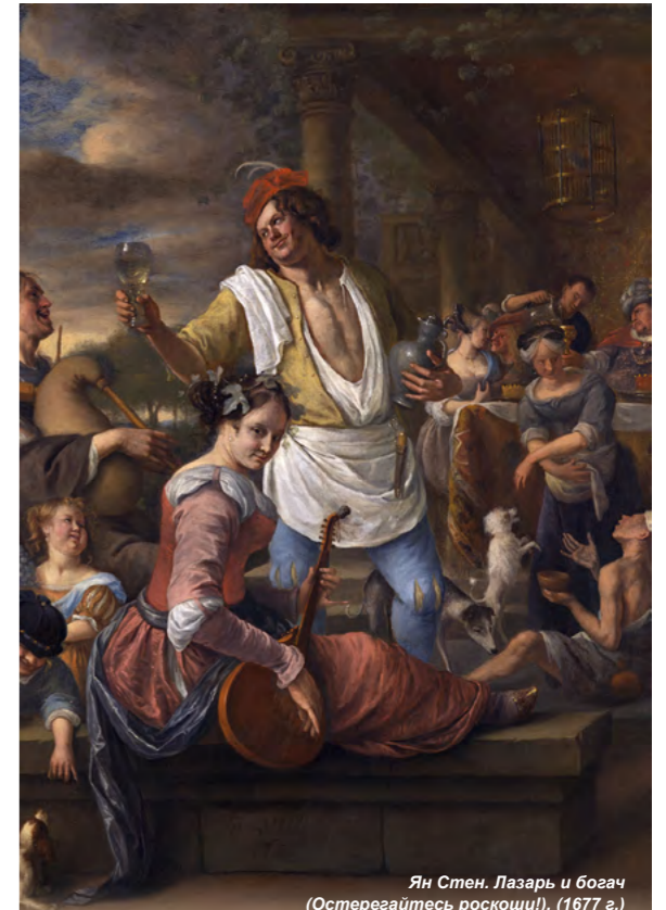
Ян Стен. Лазарь и богач (Остерегайтесь роскоши!). (1677 г.)