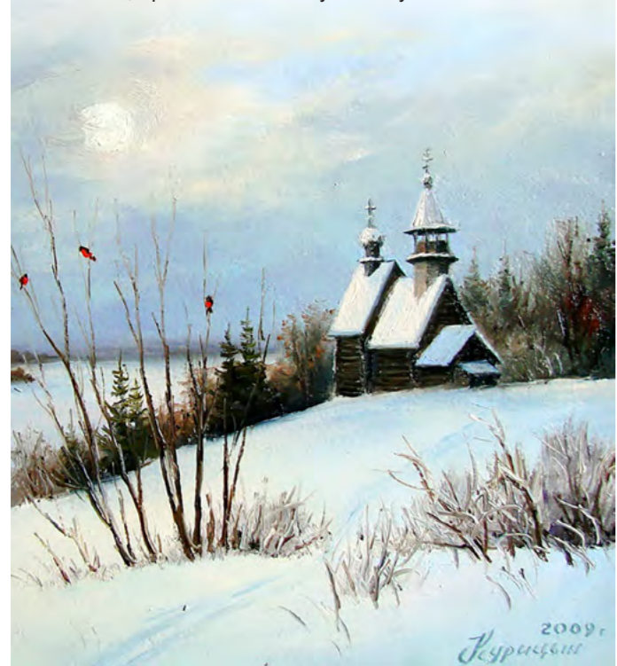
Сергей Курицын. Часовня на берегу. 2009

Постом человек изводит душу свою из земной темницы и пробивается чрез мрак бессловесной жизни к свету Царства Божия, прямо к Отечеству своему.