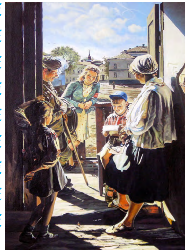
Александр Лактионов. Письмо с фронта. (1947 г.)