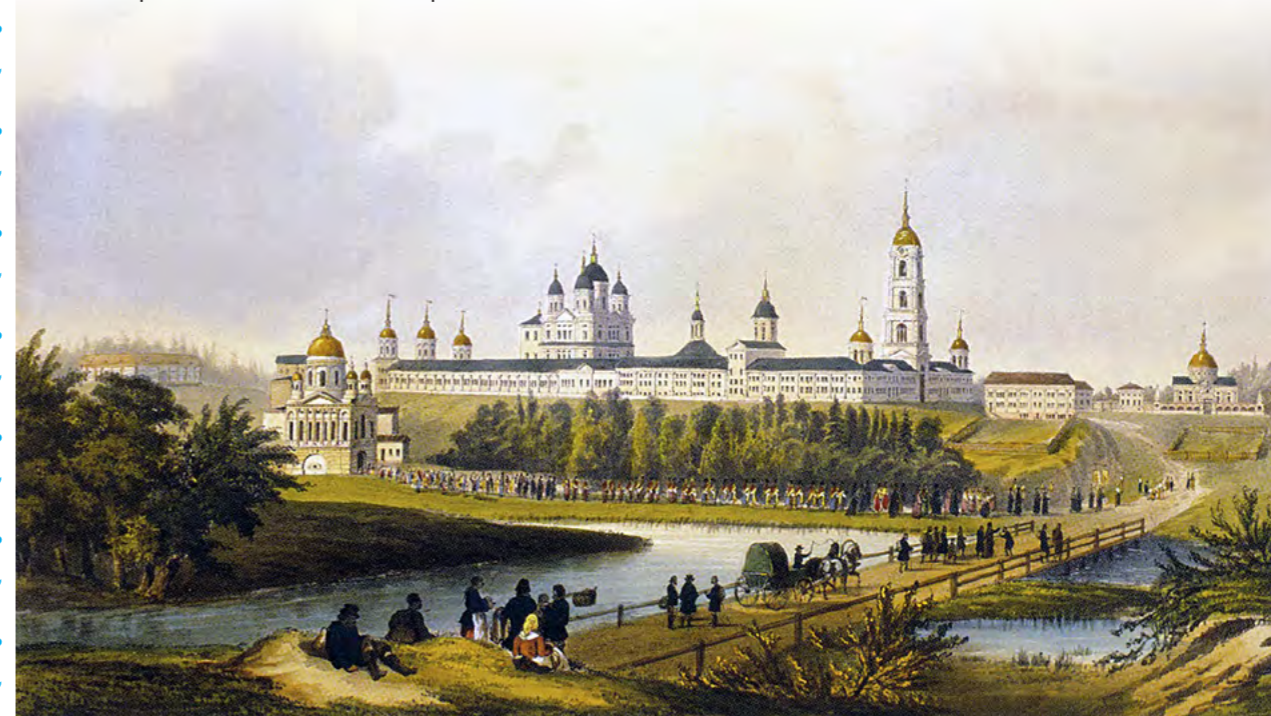
Саровская Успенская пустынь. Литография мастерской Ж. Лемерсье.

Василий (Фазиль) Ирзабеков, из книги «Русское солнце. Новые тайны русского слова»