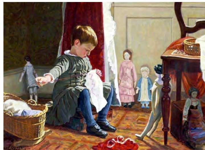
Аксель Хелстед. Девочка, шьющая в гостиной одежду для кукол. (1870 г.)

Потом ребёнку надо дать навыки труда, нужно подготовить его к жизни. Пока мы вокруг него бегаем и прыгаем, за ним ухаживаем, ему хорошо живётся, но потом-то придётся жить самому. Так что нужно учить детей трудиться, нельзя всё делать за них. Мы, сумасшедшие мамы и папы, в подавляющем большинстве случаев сами воспитываем детей эгоистами: всё делаем вместо них, боимся их заставить, на них прикрикнуть. Мы опасаемся их чем-либо обязать, хотя при разумном подходе к воспитанию с каждым годом взросления дети должны брать на себя всё большие и большие нагрузки,