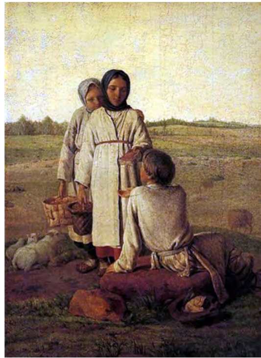
Алексей Венецианов. Крестьянские дети в поле. (1810 г.)

привыкать к общим семейным заботам. Им следует научиться стирать, гладить, убирать в доме, мыть машину во дворе; они могут почистить отцу обувь, не считая это зазорным. Пусть они, растущие помощники, разбудят родителей утром, всем на завтрак сумеют сварить хотя бы яйца вкрутую – но пока, как правило, приходится нам их будить и делать им чаёк... Мы разбаловали своих детей – попробуйте сказать, что это не так! А потом недоумеваем: как же так, почему он такой? А ему вообще ни до чего дела нет, кроме как найти в гаджете какую-нибудь гадкую картинку и рассматривать её с неотрывным вниманием, свойственным тинейджерскому возрасту.