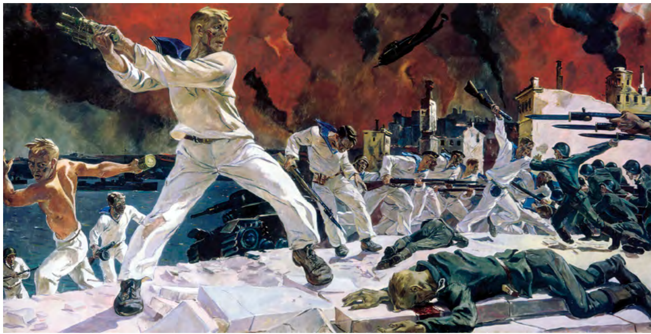
Александр Дейнека. Оборона Севастополя. (1942 г.)

Национальная армия наша представляет собою единство народа; его мужественное начало; его волю; его силу; его рыцарственную честь. Так она должна восприниматься и самим народом. В будущей России отношение народа к армии обновится и углубится. Народ не должен и не смеет противопоставлять себя – своей армии, как это было перед революцией: «мы – рабочие, крестьяне, штатские, интеллигенция», а «они – военщина, орудие реакции, усмирители, опричники, янычары»... Это болезненное и позорное отношение исчезнет навсегда. На самом деле всё обстоит иначе.