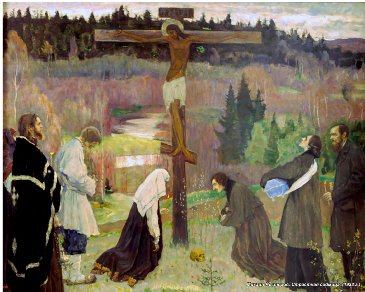
Михаил Нестеров. Страстная седмица. (1933 г.)

Тогда, во время проповеди Своей на земле Господь призвал к исцелению всех болезнующих грехом, не признав никакого греха – неисцельным. И теперь Он продолжает призывать нас к покаянию, обещая и даруя прощение всякого греха, исцеление всякого греховного недуга.