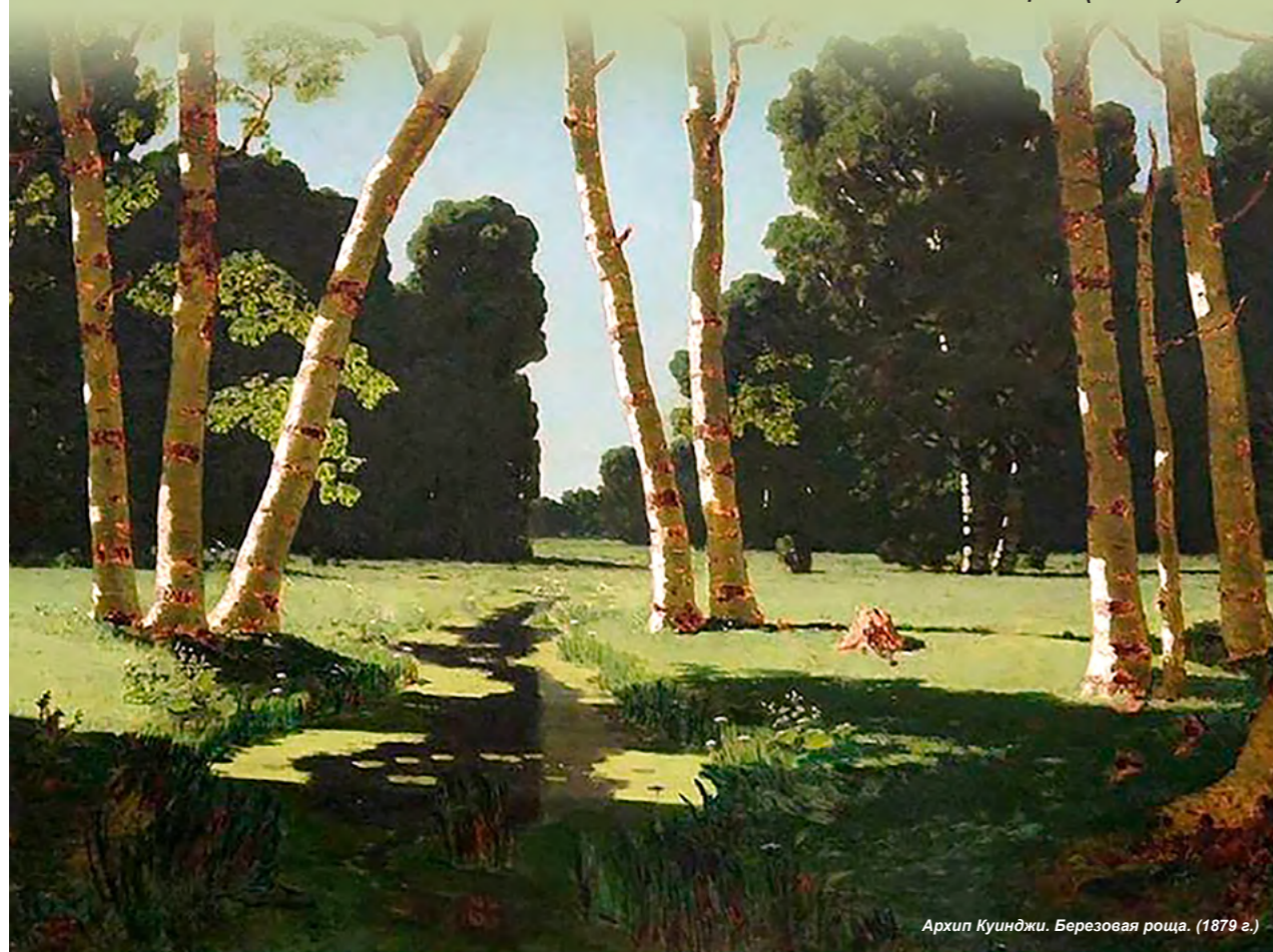
Архип Куинджи. Березовая роща. (1879 г.)