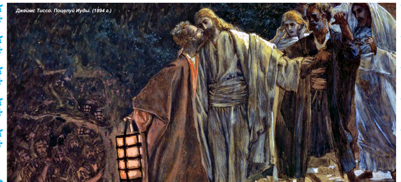
Джеймс Тиссо. Поцелуй Иуды. (1894 г.)