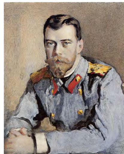
Валентин Серов. Портрет Николая II в тулурке. (1900 г.)