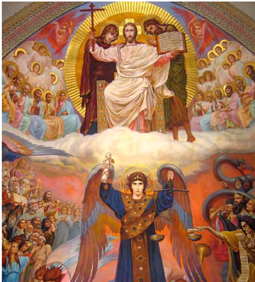
Виктор Васнецов. Страшный суд. Копия фрески Владимирского собора в Киеве.

на восток: «Смотри!». И я увидел множество людей с радостными лицами, в руках них были кресты и свечи. На высоком престоле в воздухе парила золотая царская корона с надписью: «На малое время». Престол окружали патриархи, епископы, священники, монахи и миряне. Все они пели: «Слава в вышних Богу и на земли мир». Я перекрестился и тоже поблагодарил Бога.