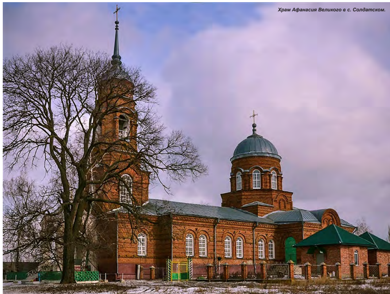
Храм Афанасия Великого в с. Солдатском.

В начале XX века в селе мог появиться каменный храм с двумя приделами, освящёнными во имя святителей Димитрия Ростовского и Митрофана Воронежского: уже был заключён договор с подрядчиком, однако дальше этого дело почему-то не пошло. Зато в 1913 году появилась каменная церковь, освящённая во имя Афанасия Великого ( празднование памяти 31 января ), которая и дожила до наших дней. Архитектура храма изящна, сочетает элементы русского и византийского стиля. Выглядит храм стройным красавцем, стены сложены из буро-красного кирпича. Афанасьевская церковь, как утверждают местные жители, не закрывалась «ни при советской, ни при немецкой власти». В тридцатые годы прошлого века пытались храм взорвать, но мудрый председатель колхоза, хоть человеком слыл и неверующим, однако, как сам он говорил, «Бога боявшийся», засыпал в трапезную церкви все зерновые запасы, заявив при этом проверяющим, что зерно ему хранить больше негде. «Если хотите, взрывайте», – развёл руками председатель. Вот так и спасли церковь. Подобная практика, кстати, была в те годы весьма и весьма распространена.