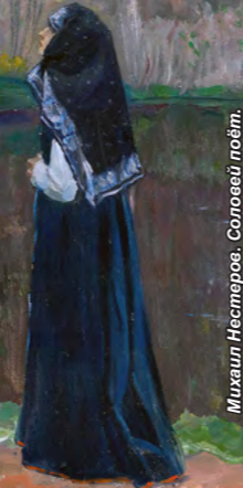
Михаил Нестеров. Соловей поёт.

Николай Некрасов. «Рыцарь на час» (фрагмент)