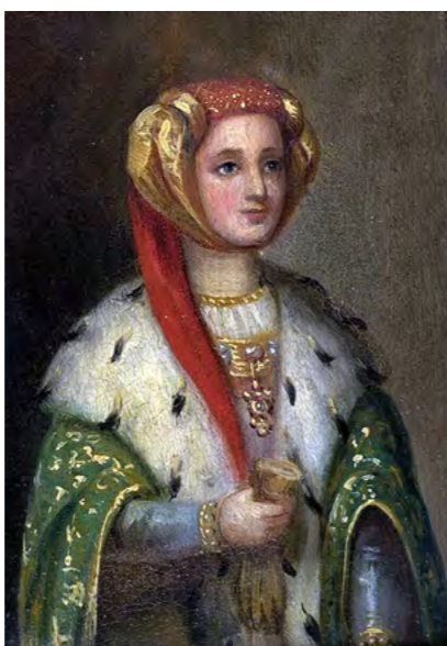
Марсели Краевский. Елена Иоанновна Московская, королева Польская. (1866 г.)

И великий князь Иван Васильевич Всея Руси послал по этому поводу в Литву к своему зятю своих послов: Бориса Васильевича Кутузова и дьяка Андрея Майка, чтобы его дочь великую княгиню Елену не принуждал князь перейти от греческого вероисповедания к римскому». Итак, духовно поддерживающая Елену Иоанновну увезённая из Москвы икона Божией Матери оказалась в городе Вильне – столице Литовского княжества, отчего и обрела название «Виленская». Иконе было установлено празднование 28 февраля (15 февраля ст.ст.) в честь перенесения её в Вильну и 27 (14 ст.ст.) апреля .