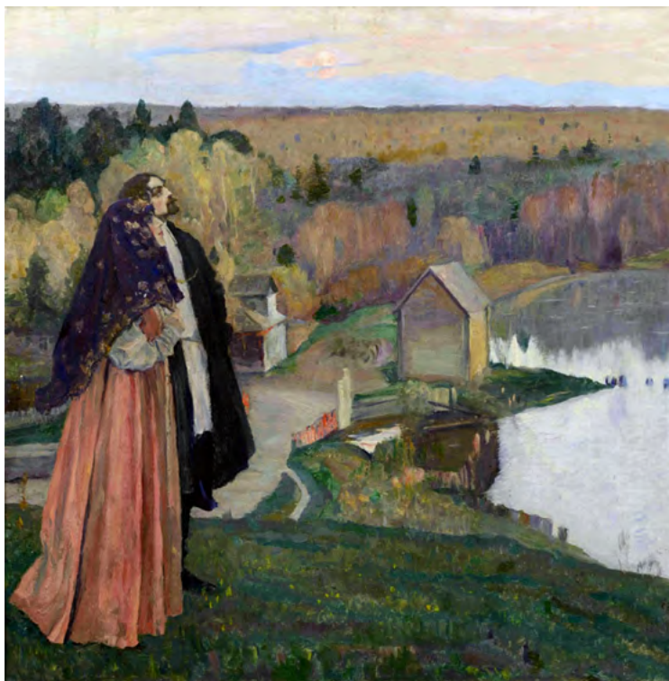
Михаил Нестеров. Весна.

И он ходил к бывшей жене, а она не пускала его на порог; он дарил ей цветы, а она выбрасывала их на помойку... Он хотел увидеть ребёнка, а ему не давали свидания... Он издали видел свою жену с тем, новым – и сердце у него разрывалось... Но он говорил: «Господи, Ты же видишь: я каюсь. Прости меня, дай мне быть мужем, оставаться отцом...». И он держался несмотря ни на что. Продолжал звонить... встречать... искать общения и дарить цветы... Не с дерзостью, понимаете, не с гонором, а с любовью.