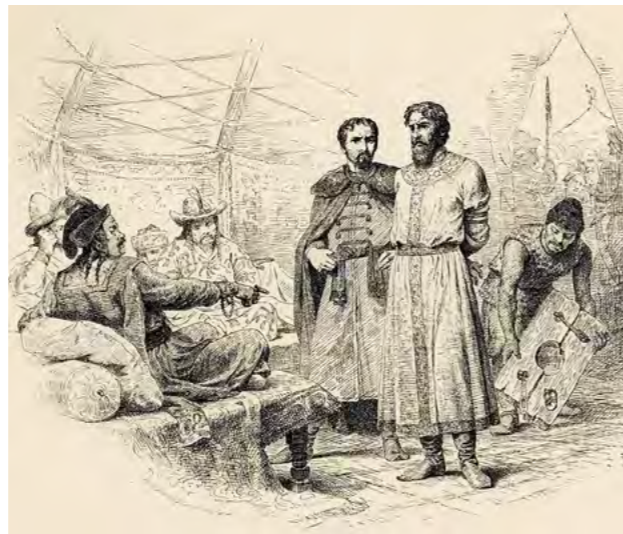
Василий Верещагин. Михаил Ярославич Тверской у Узбек-хана. (1890 г.)

По наущению Юрия Даниловича и Кавгадия в стан, где томился пленник, явились убийцы. Добравшись до князя, они зверски топтали ногами мученика, наконец один из душегубов вонзил в Михаила нож.