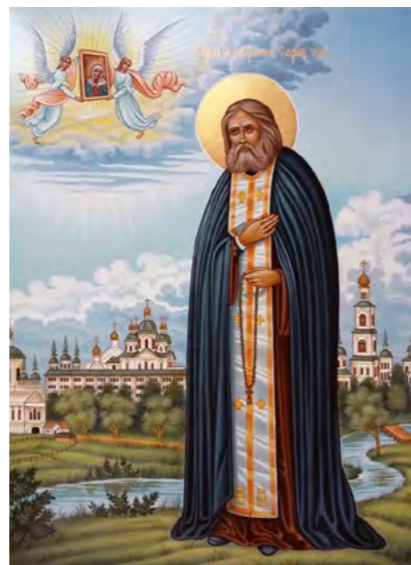
Прп. Серафим Саровский. Икона Троицкого собора Серафимо-Дивеевского монастыря.

Мы продолжили наш путь и вошли в огромный храм. Я собрался осенить себя крестным знаменем, но старец остановил меня словами: «Это место проклято и заброшено!». Я взгляделся. Вижу впереди место с тёмным алтарём. Вместо иконостаса и святых изображений висят портреты со звериными чертами и в острых шляпах, на алтаре вместо креста – огромная звезда и большая книга, тоже со звездой и на «просфорах» также звёзды, рядом горят смоляные свечи, щёлкая,