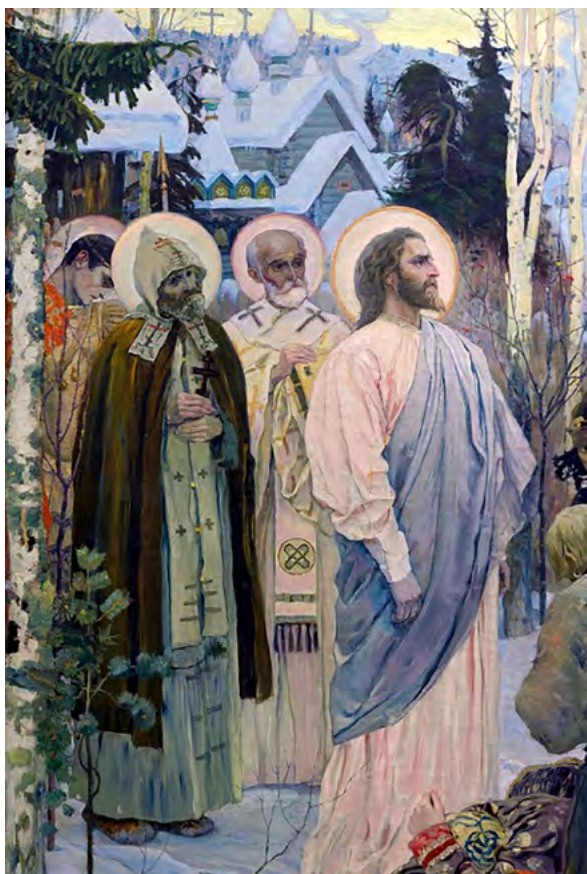
Михаил Нестеров. Святая Русь. Фрагмент. (1901-1905 гг.)

Очистившись от скверны страстей непрестанными подвигами Богомыслия, молитвы и воздержания, не избегая и телесных трудов, угодники Божии просияли, как солнце, и ещё при жизни на земле нередко озарялись неземным светом, а при кончине имели спутниками на Небо светносных Ангелов. Так прославил Господь и преподобного отца нашего Серафима Саровского».